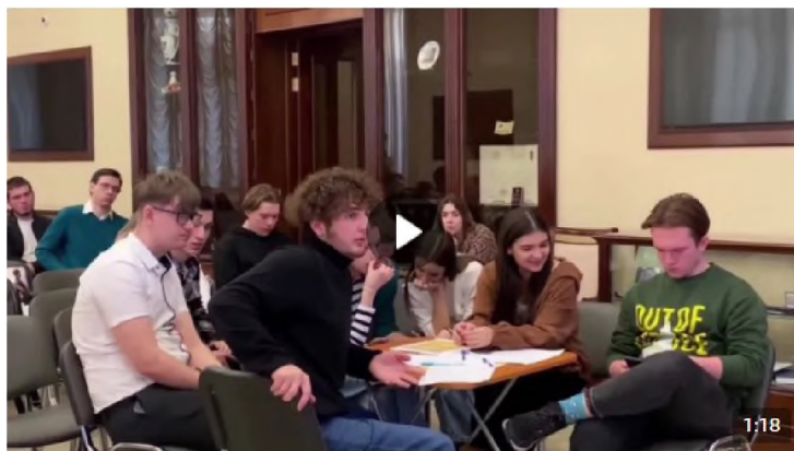
Дебаты «Идеология радикальных организаций» 1 888 просмотров

В рамках дебатов можно: развенчивать мифы, декларируемые представителями радикальных идеологий для вербовки; развивать навыки критического мышления и ведения дискуссии; формировать в целом антитеррористическое сознание и активную гражданскую позицию. Рекомендуется для мероприятия вовлекать не более 20 человек (см. рисунок 5).