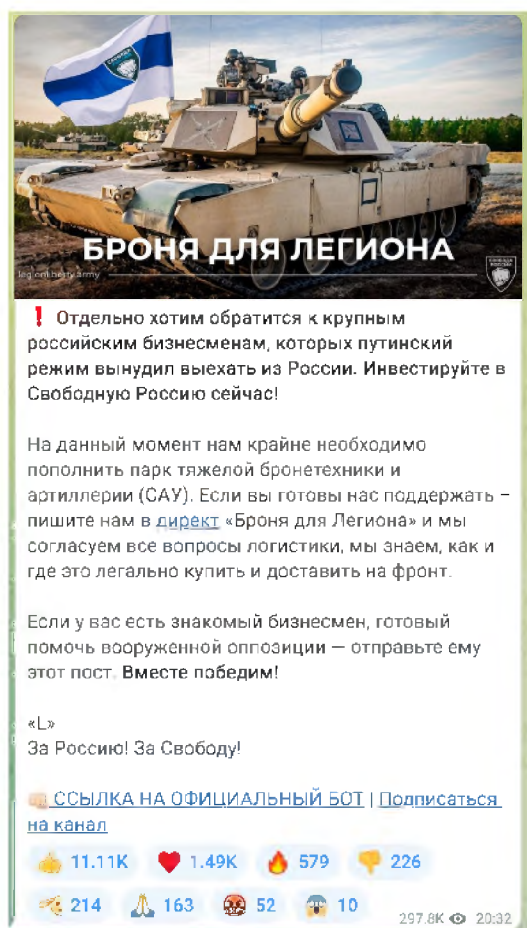
Рисунок 3 — Скриншот телеграм-канала легиона «Свобода России» с призывом к финансированию

Важно подчеркнуть, что помимо собственно пропаганды и распространения идеологии террористических организаций, а также вовлечения в деятельность террористических организаций существует еще одна угроза террористического характера — ложные сообщения о готовящемся террористическом акте. Только за 2021 год зафиксировано более 4,5 тысяч ложных сообщений о готовящихся терактах на объектах социальной инфраструктуры. Это может быть хулиганство, злой умысел, специфическое чувство юмора, желание проверить качество работы правоохранительных органов или антитеррористическую защищенность объекта и др. Во всех вышеперечисленных случаях за такой поступок придется нести уголовную ответственность. Ведь злоумышленник нарушает конструктивную деятельность общественных объектов, а правоохранителям приходится задействовать множество средств и сил, чтобы проверить объекты, которые якобы находятся под угрозой. За ложное сообщение о готовящемся теракте правонарушитель может быть наказан либо штрафами – от 200 тысяч рублей и до двух миллионов рублей, либо лишением свободы – от одного года до 10 лет. Ответственность за данный вид правонарушения наступает с 14 лет (статья 207 УК РФ «Заведомо ложное сообщение о акте терроризма»).