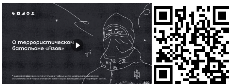
Рисунок 2 – Видеоролик, разъясняющий причины признания организации террористической

3) батальон «Азов» (см. рисунок 2) — военизированное подразделение, созданное в 2014 году на базе футбольных ультрас и праворадикалов Харькова и некоторых других украинских регионов. «Азовцы» причастны к массовым военным преступлениям против мирного населения Донбасса и Украины. Сама организация признана террористической в России по решению Верховного Суда Российской Федерации от 02.08.2022 г. № АКПИ22-411С. Батальон «Азов» входит в состав Национальной гвардии, подчиненной Министерству внутренних дел Украины. С 2014 года боевики батальона «Азов» систематически пытали, убивали и грабили мирных жителей ДНР, ЛНР и востока Украины. У батальона неонацистская идеология. Это проявляется в расизме, русофобии, восхвалении наследия Третьего рейха и украинских коллаборационистов в годы Второй мировой войны. Среди боевиков в том числе распространены радикальные неоязыческие взгляды. Свою идеологию боевики активно распространяют среди украинской молодежи через лагеря подготовки, печатную продукцию (комиксы, книги) и интернет-сообщества. С «Азовом» активно сотрудничает большое количество праворадикальных течений на Украине (признанных в России экстремистскими организациями), например, «Правый сектор», «УНА-УНСО», организация «Тризуб им. Степана Бандеры» и т.д.