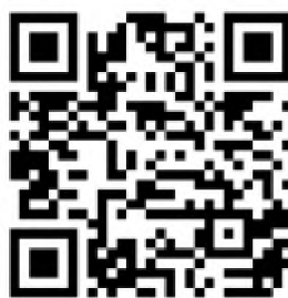
Рисунок 6 — Рекомендации по проведению кинопоказов в профилактике

Среди фильмов по тематике противодействия терроризму можно использовать следующие фильмы: «Беслан. Память» (Россия, 2014 г., возрастное ограничение: 12+), «Кавказский пленник» (Россия, 1996 г., возрастное ограничение: 18+), «Я не террорист» (Узбекистан, 2021 г., возрастное ограничение: 18+), «Отель Мумбаи: противостояние» (США, Австралия, 2018 г., возрастное ограничение: 18+) и т.д.