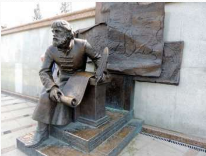
Отель «Ремезов»( г. Тюмень)