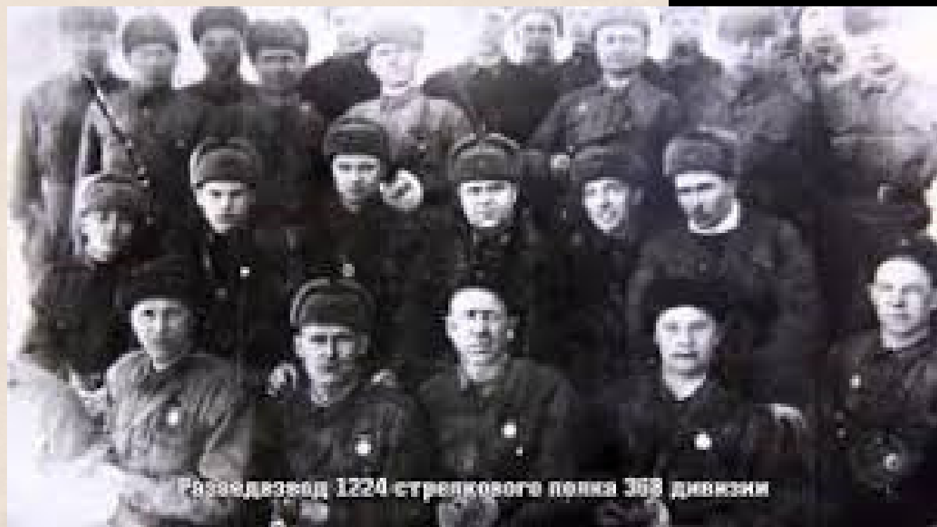
Разведдивизион 1224 стрелкового полка 368 дивизии

Согласно Директиве Ставки ВГК № 004275 командующему войсками СибВО о формировании 58-й резервной армии от 2 ноября 1941 года дивизия включена в состав 58-й резервной армии и к 7 ноября 1941 года приказано было подготовить дивизию к переброске в Вытегру.