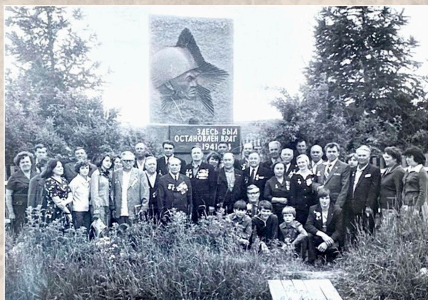
Встреча ветеранов 368-й Печенгской Краснознаменной стрелковой дивизии, участников Великой Отечественной войны (1941-1945 гг.), у памятника «Здесь был остановлен враг», где проходила линия фронта в 1941-1944 гг. Групповой портрет. с.Ошта, Оштинский район, Вологодская область, 1979.