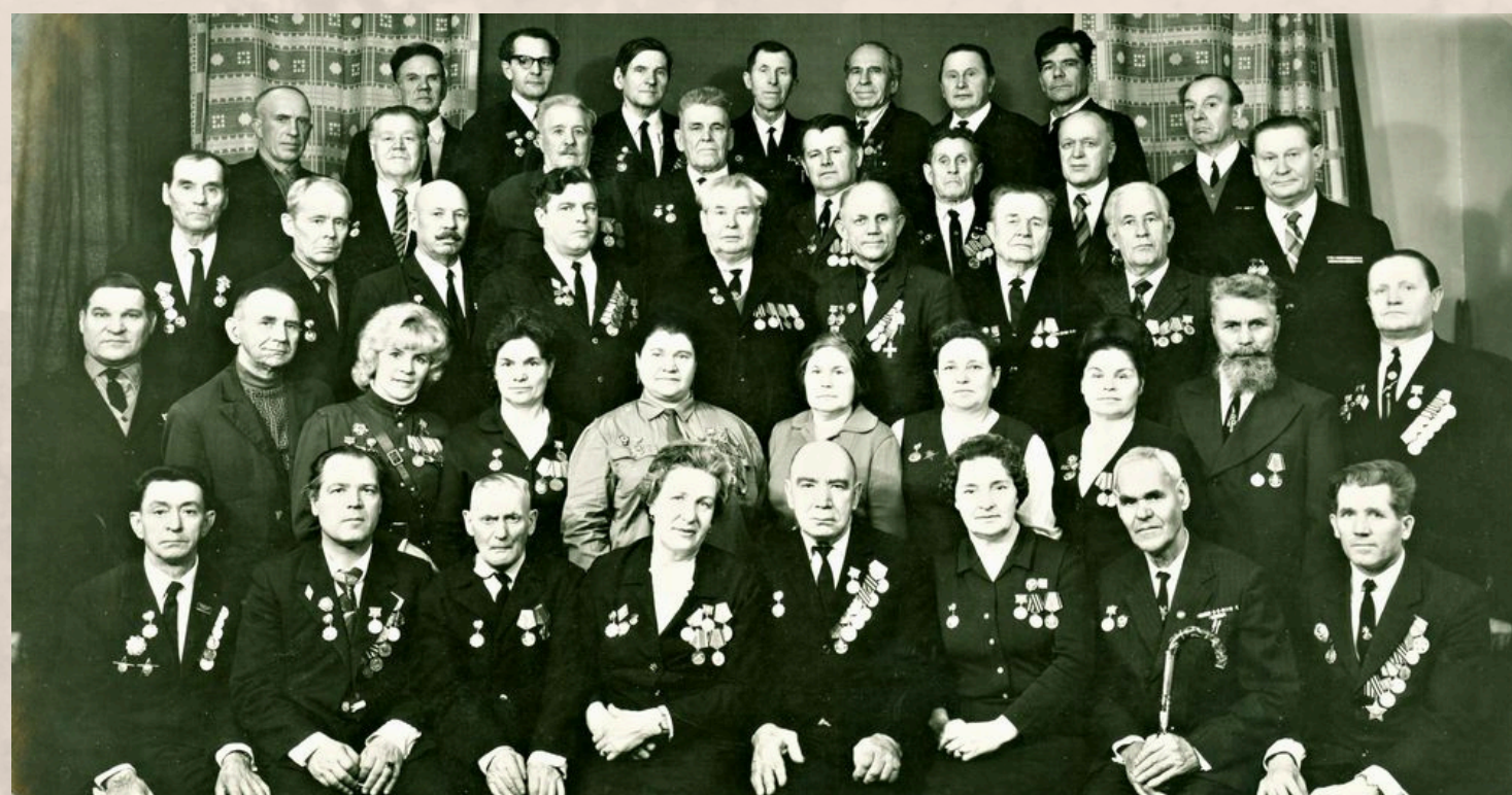
Ветераны 368-й Печенгской Краснознаменной стрелковой дивизии, участники Великой Отечественной войны (1941-1945 гг.). Групповой портрет. Тюменская группа. г.Тюмень, 01.1975.