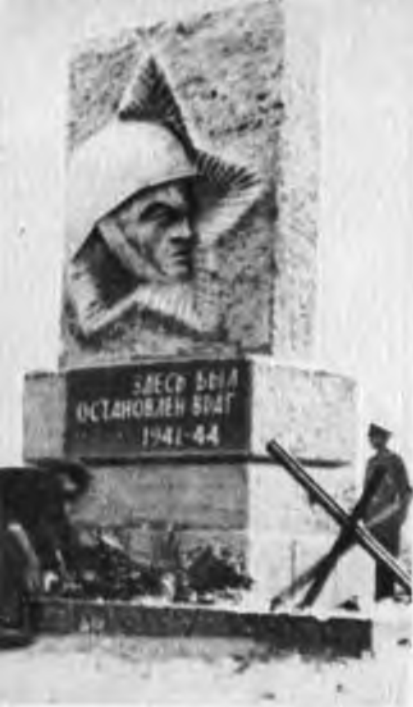
Обелиск у развилки дорог около деревни Коромы- лово (Вологодская обл.).