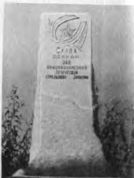
Обелиск у школы № 10 (г. Тюмень).