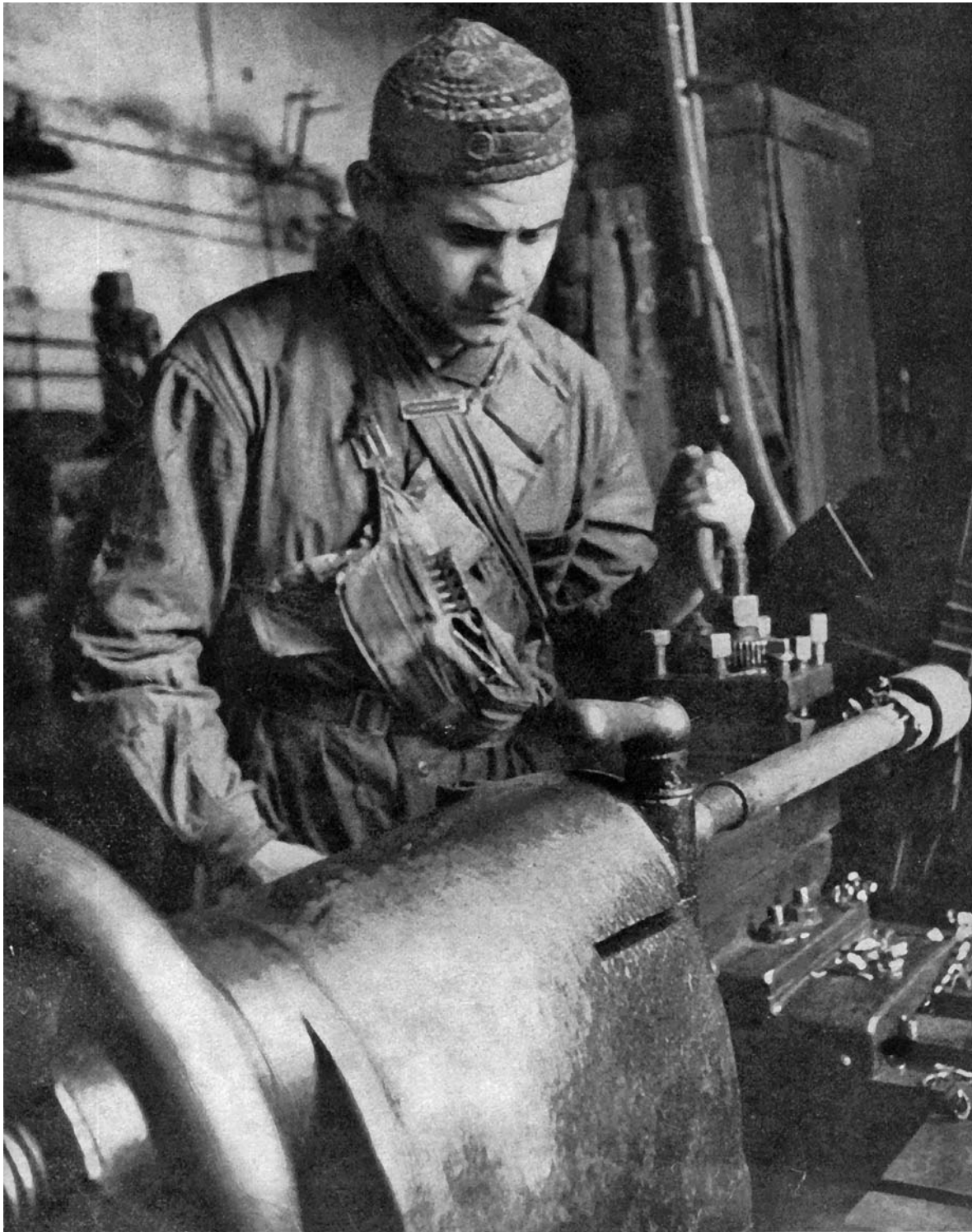
Токарь у заводского станка в блокадном Ленинграде