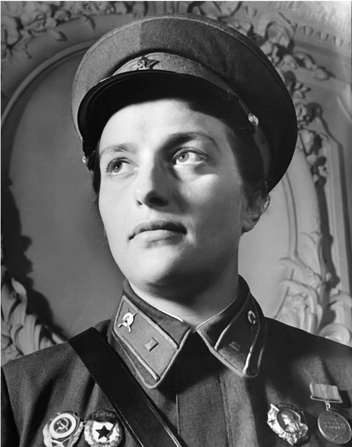
Снайпер Людмила Павличенко