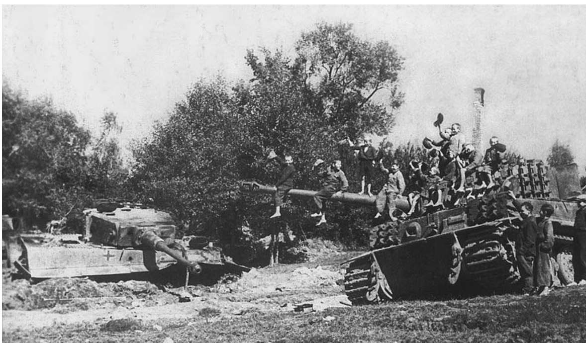
Белорусская детвора у подбитых немецких танков