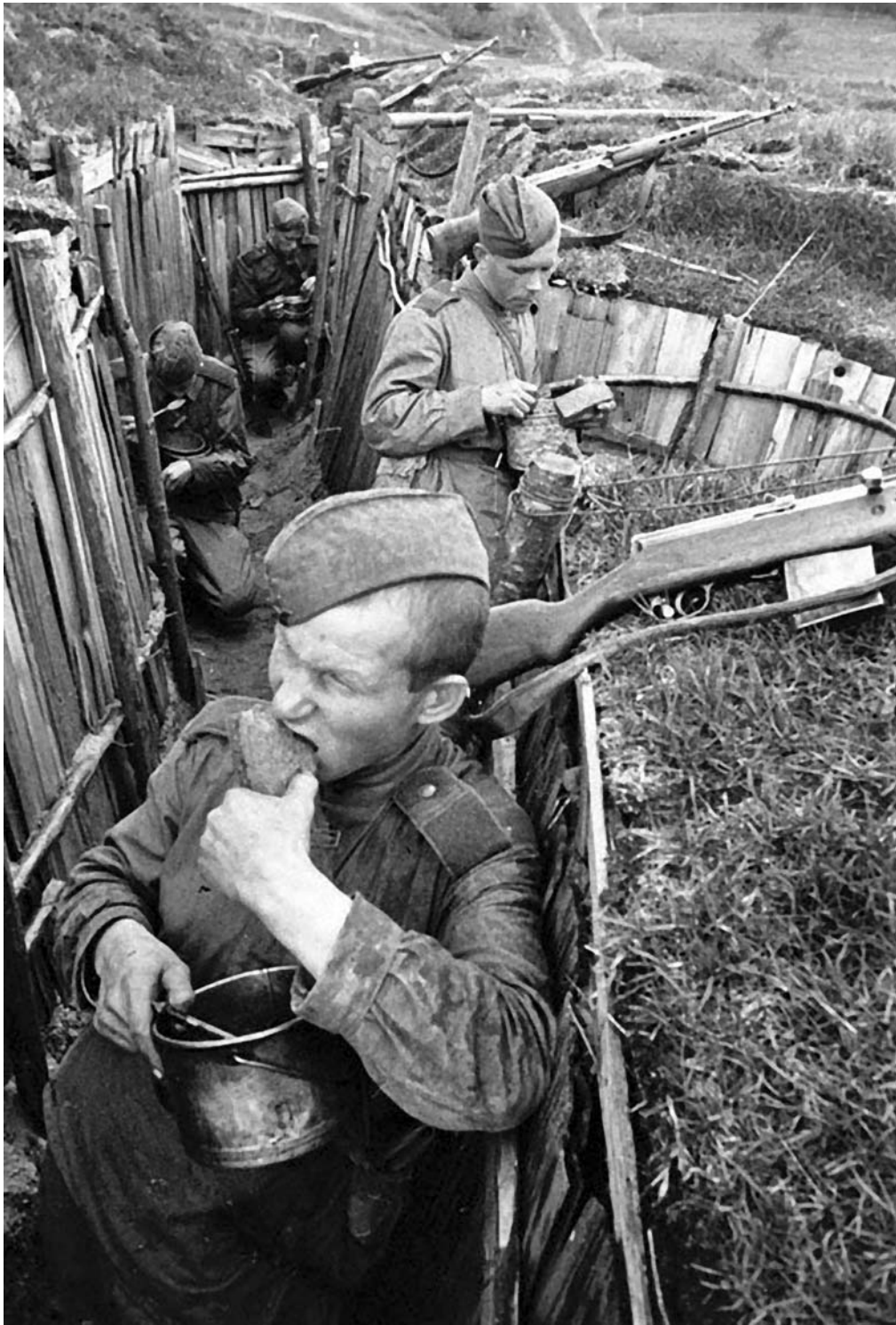
Обед на позиции