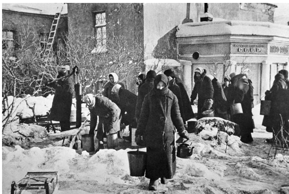
Водоразборные колонки в блокадном Ленинграде