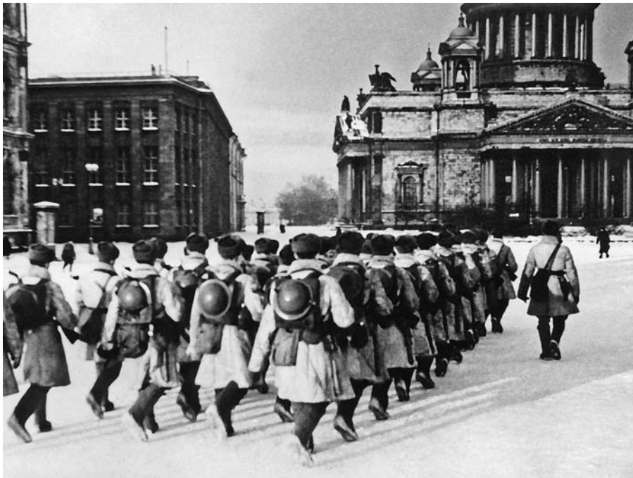
На марше защитники города на Неве