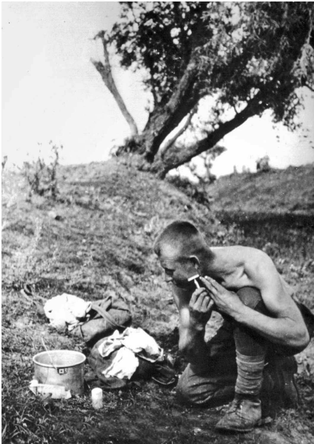
В бою силен, в быту опрятен