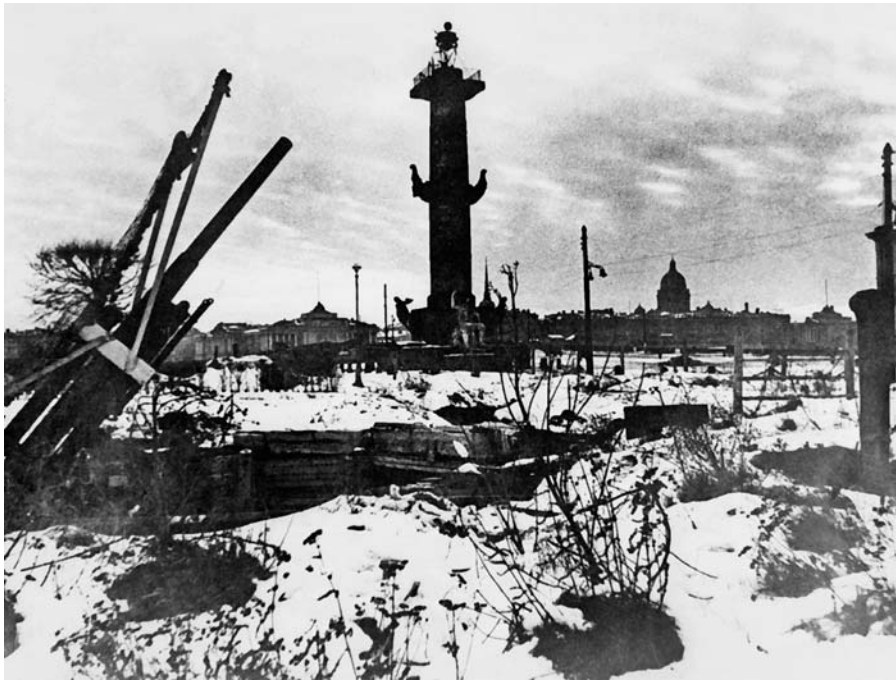
Позиция зенитной батареи на Стрелке Васильевского острова в Ленинграде