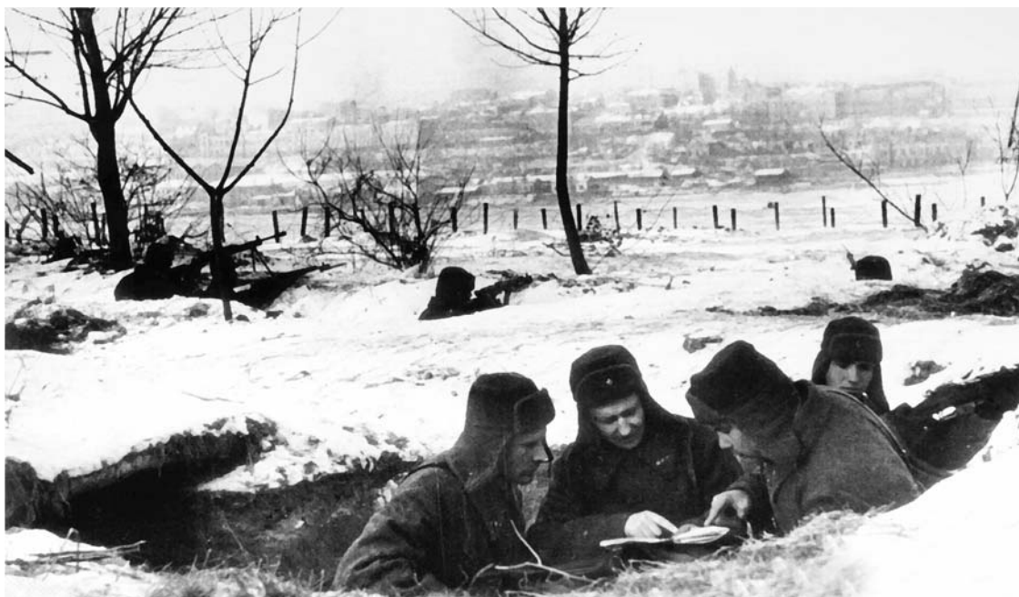
Уточнение обстановки перед боем