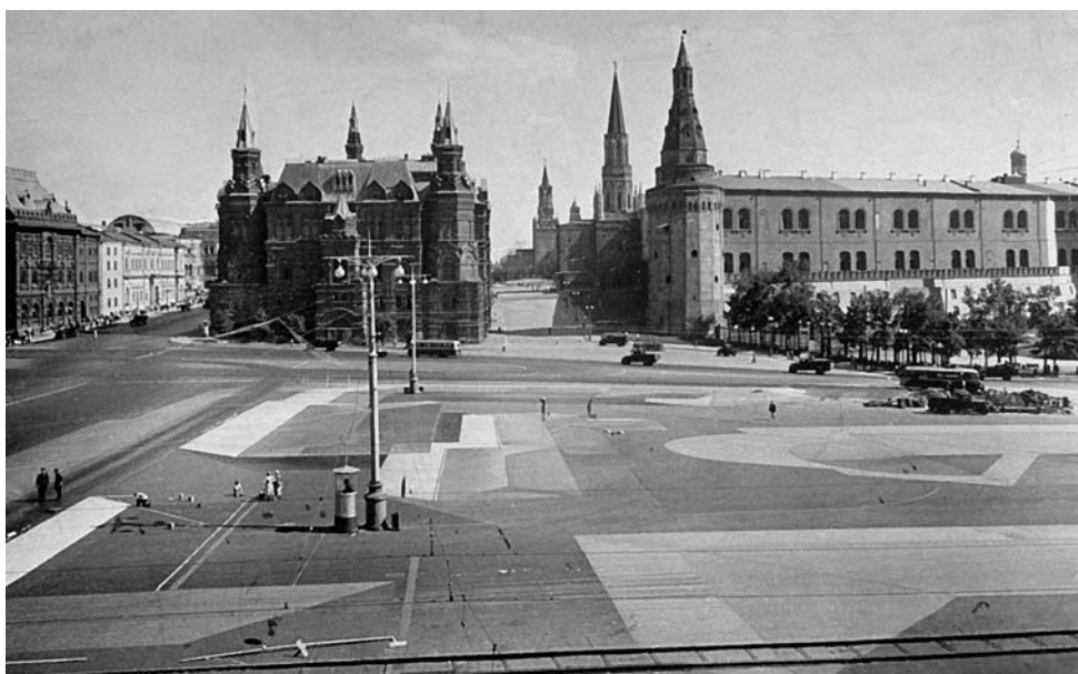
Женская бригада на маскировочных работах на Манежной площади в Москве