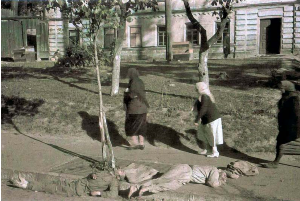
Убитые фашистами советские военнопленные на одной из киевских улиц