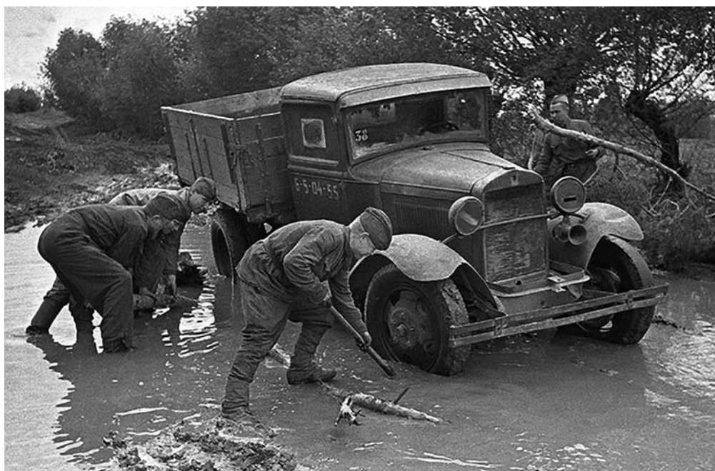
Эх, путь-дорожка фронтовая...