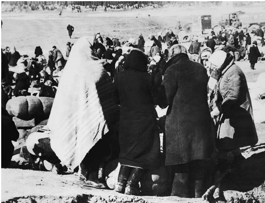
Эвакуированные ленинградцы в порту Кобона