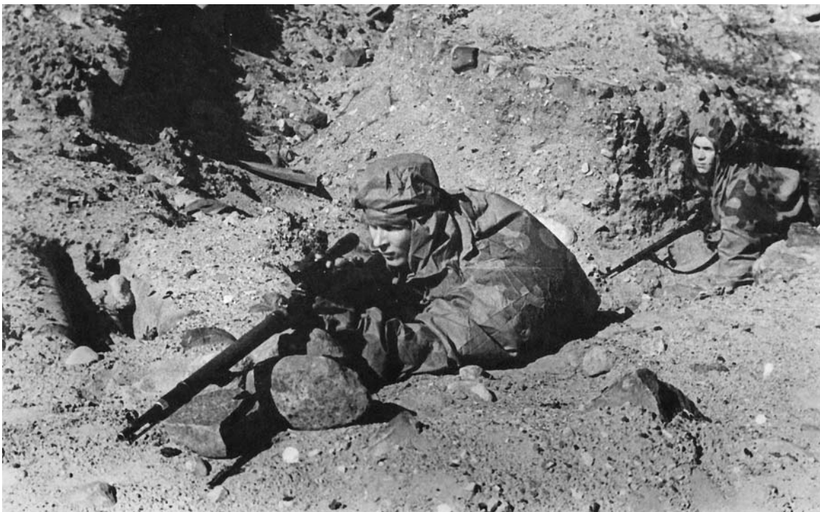
Снайперы выбирают позицию