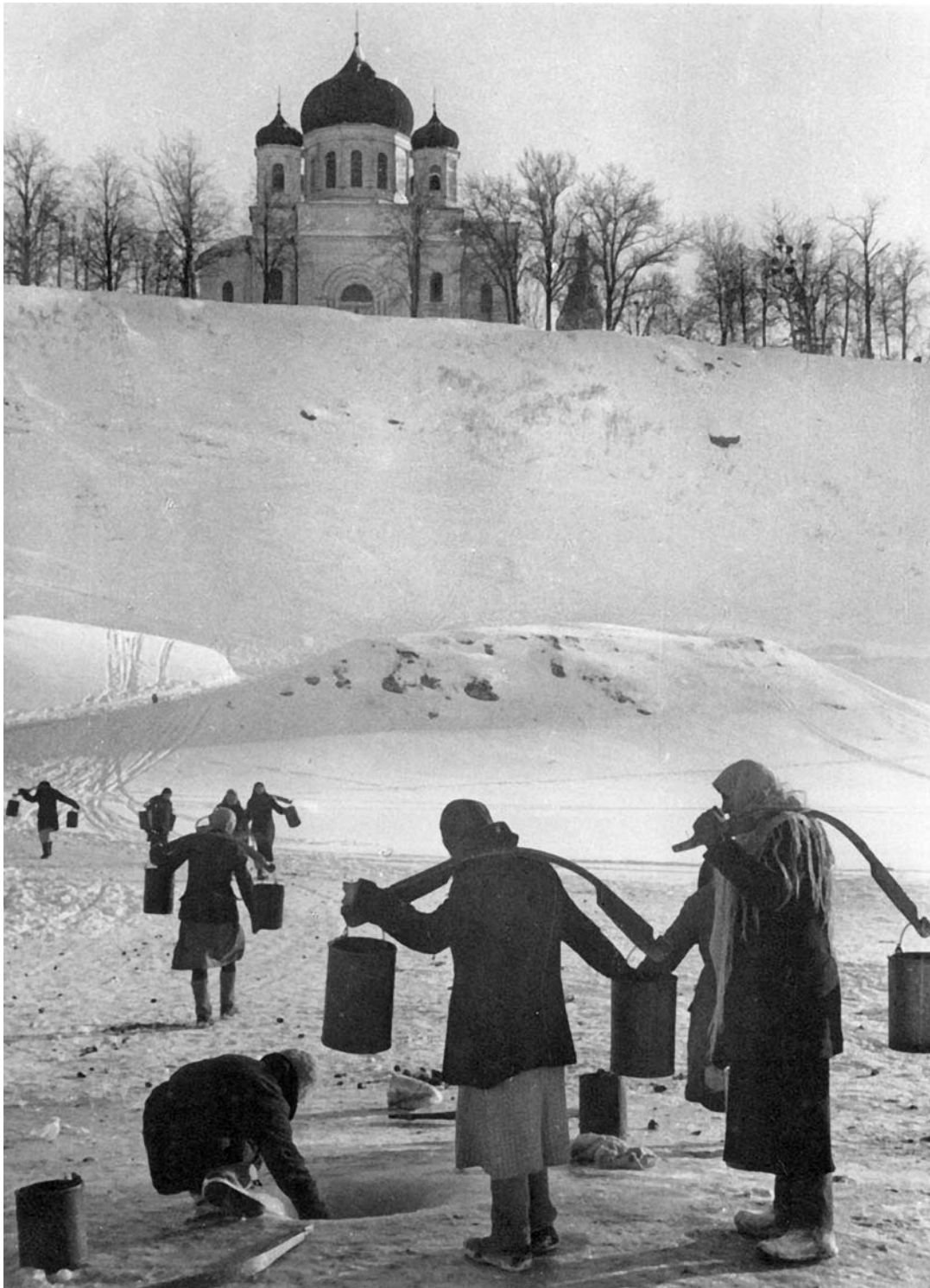
Жители города Ржева в очереди за водой