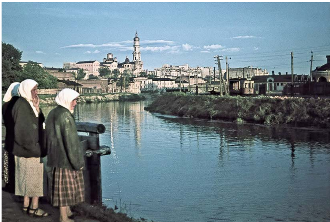
Мирные жители на берегу реки Лопань в оккупированном Харькове