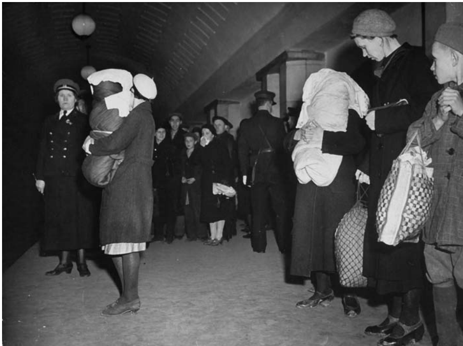
Москвичи с детьми укрываются в метро во время налета немецкой авиации