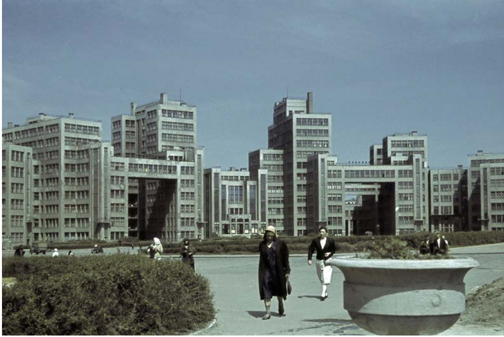
Здание Госпрома в занятом гитлеровцами Харькове