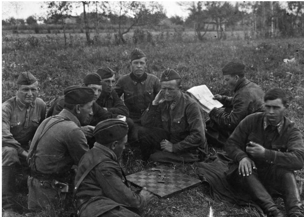
В минуты затишья