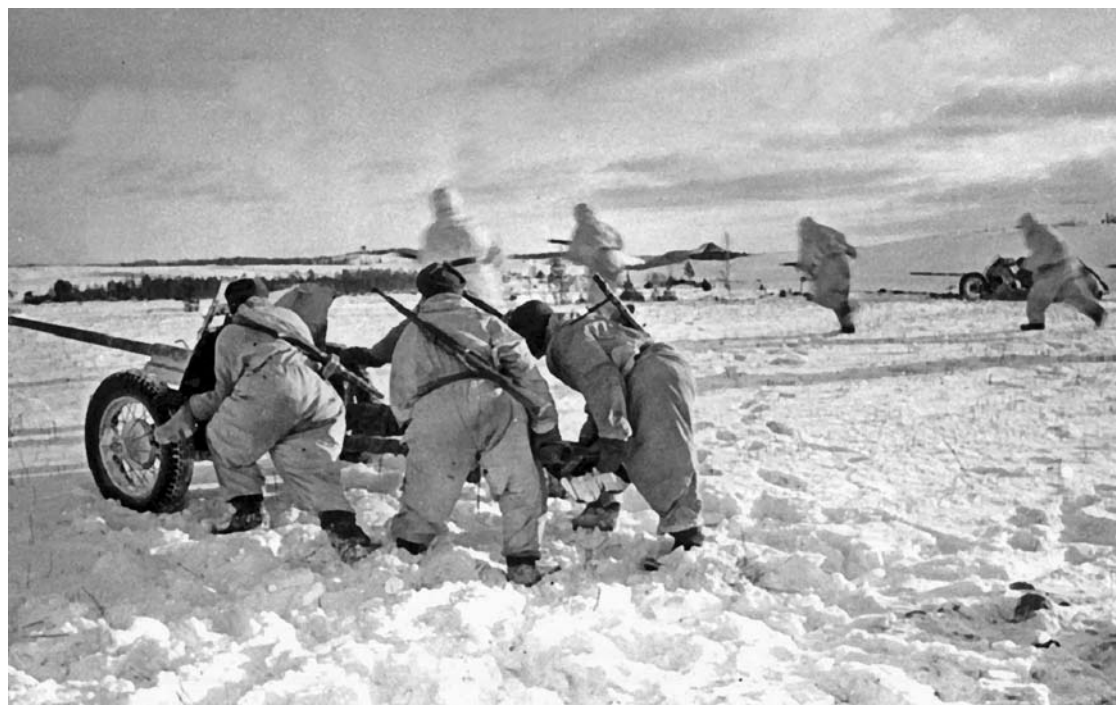
Расчеты противотанковых орудий в рядах наступающей пехоты