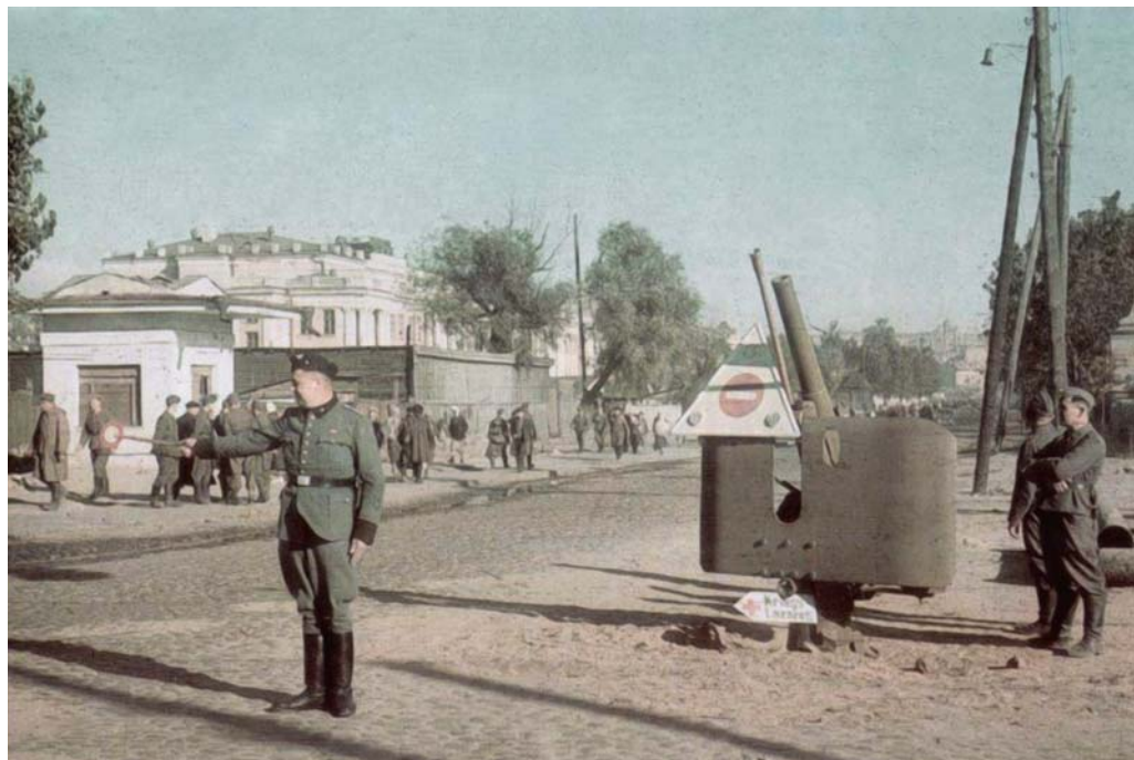
Немецкий регулировщик у блокпоста в Киеве