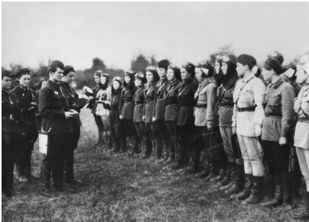
Командир женского авиаполка Е. Д. Бершанская ставит боевую задачу своим подчиненным