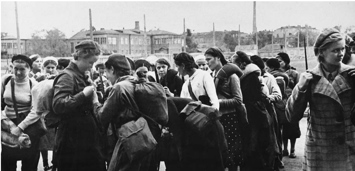
Девушки-добровольцы уходят на защиту Москвы