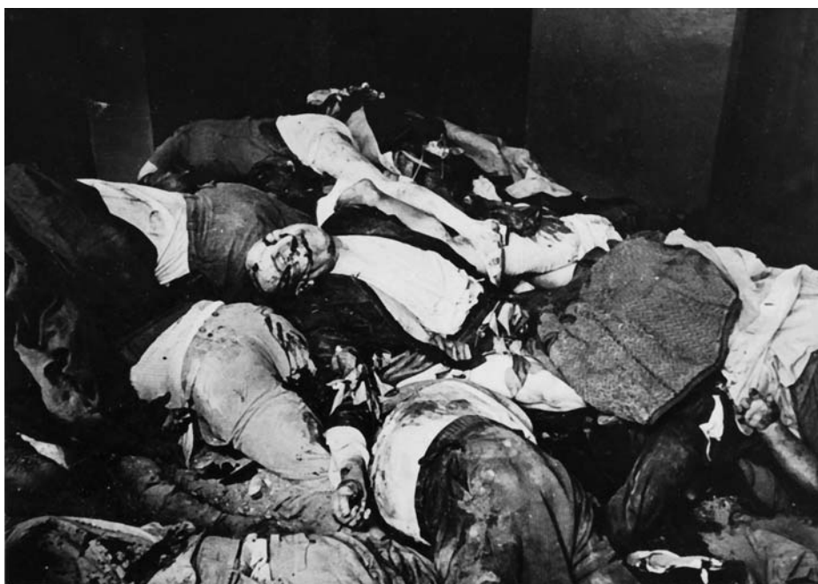
Жертвы нацистского погрома во Львове