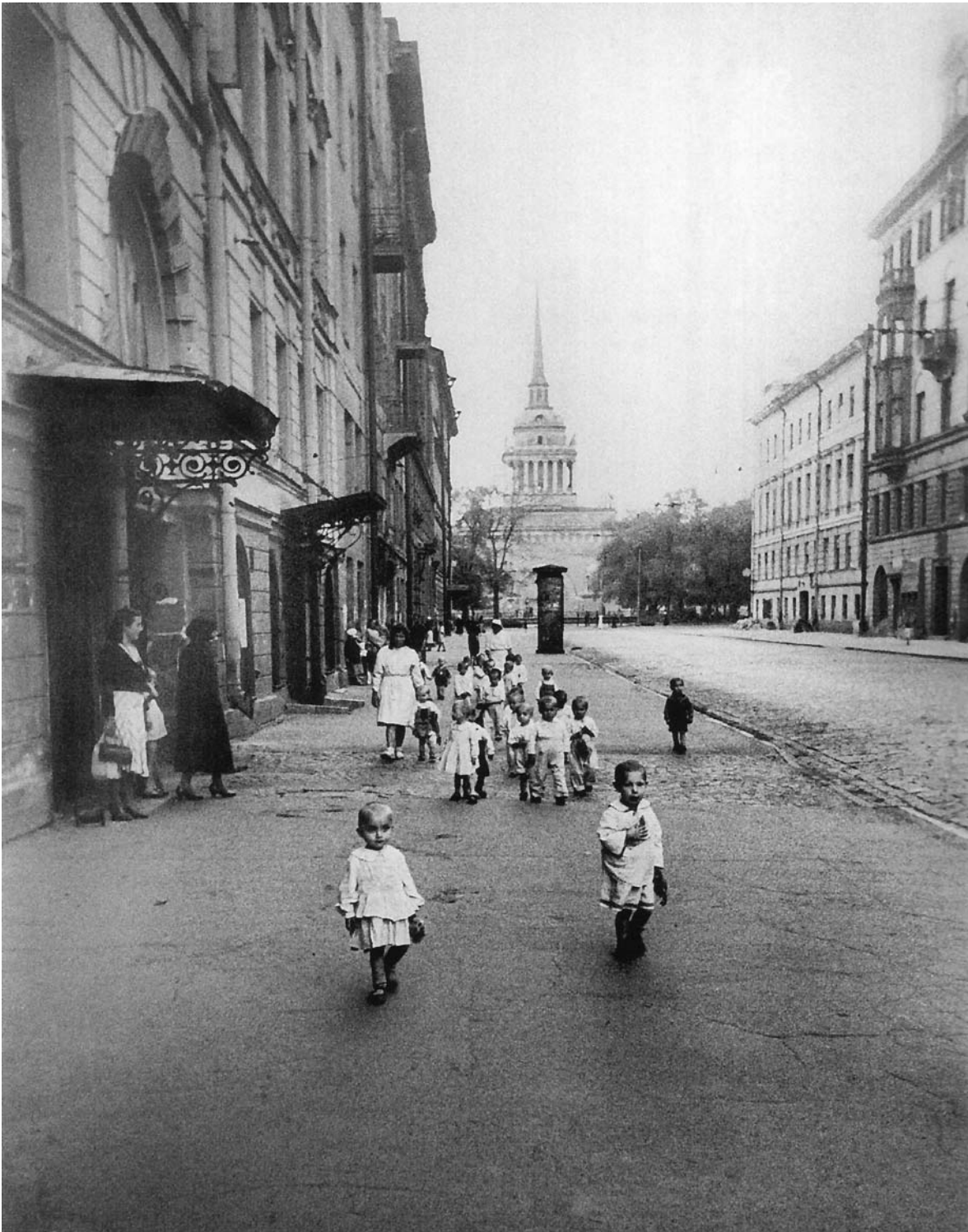
Маленькие воспитанники ленинградского детского сада на прогулке