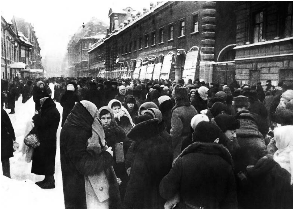
Толкучка у Кузнечного рынка