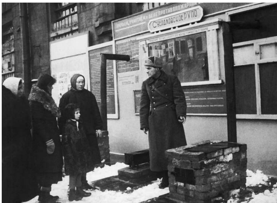
Практические занятия с блокадниками по строительству и эксплуатации печек в жилых помещениях