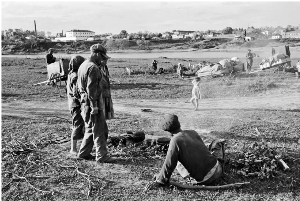
Советские беженцы у реки Сейм в оккупированном Льгове Курской области