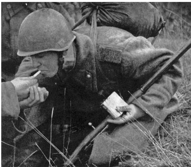
Давай закурим, товарищ, по одной...