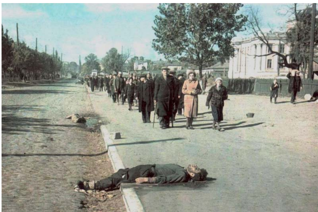
Тела погибших киевлян на бульваре Тараса Шевченко