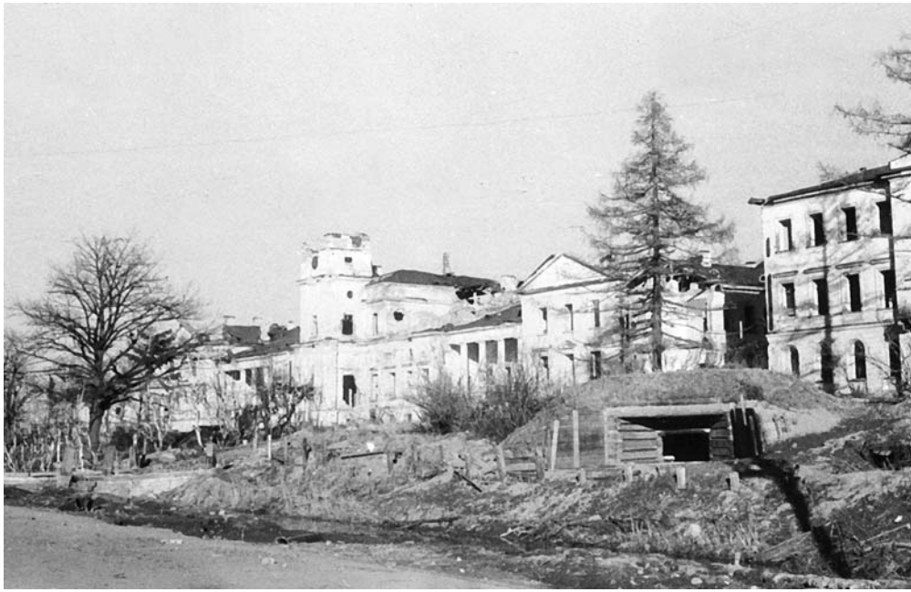
Дзот у корпусов больницы имени Фореля на проспекте Стачек в блокадном Ленинграде