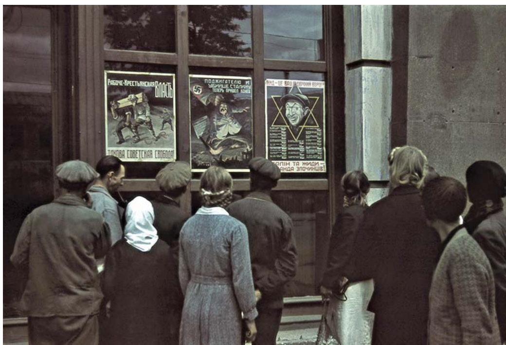
Антисоветская пропаганда на улицах города