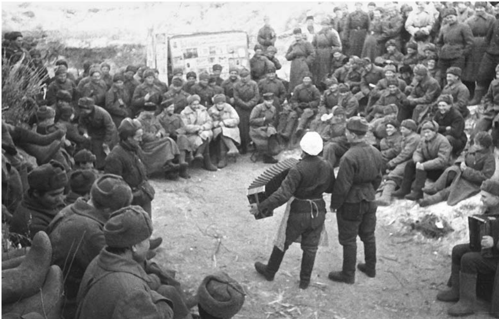
Играй, мой баян, и скажи всем врагам, что жарко им будет в бою!