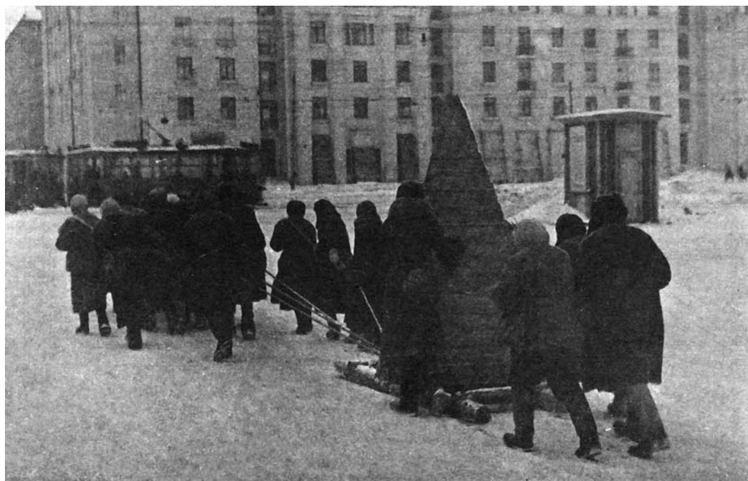
Перевозка надолб на Московском шоссе в блокадном Ленинграде