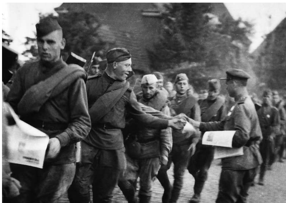
Свежий номер нарасхват