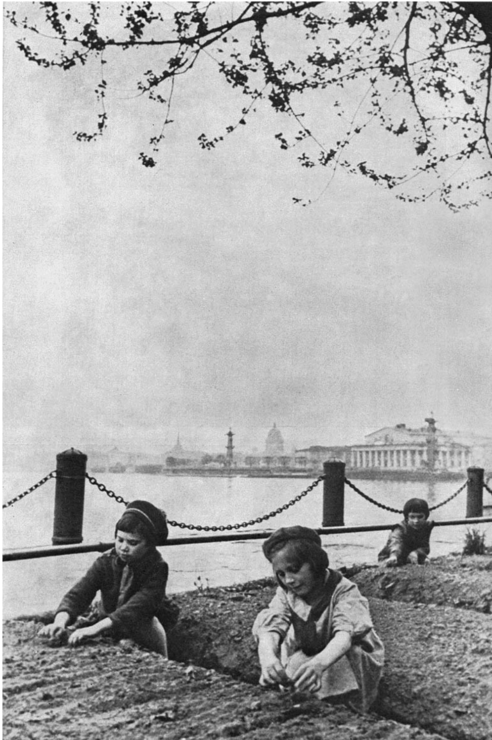
Дети блокадного Ленинграда у грядок на Мытнинской набережной