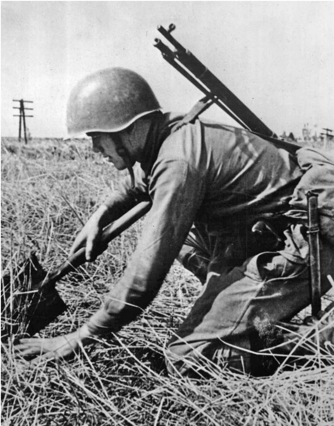
Красноармеец-сапер устанавливает мину