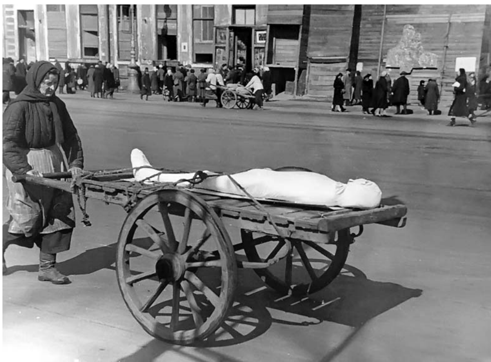
Тела умерших от голода на улицах Ленинграда