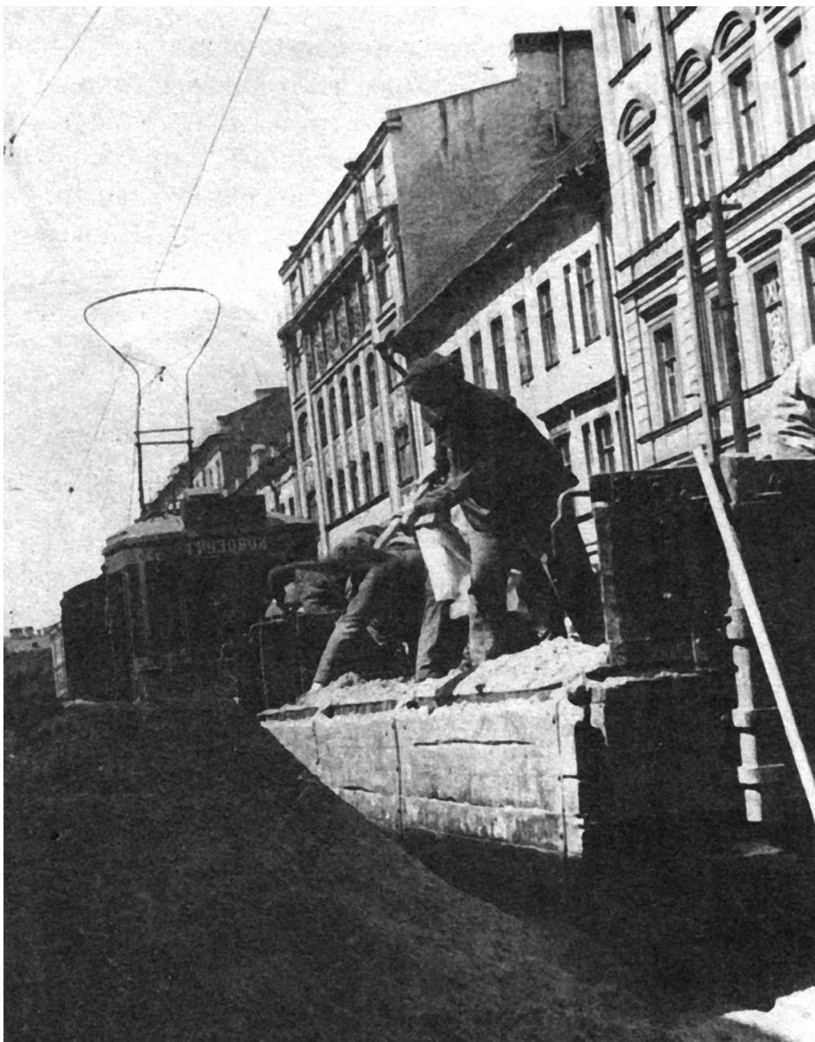
Выгрузка песка из трамвайного вагона на Стремянном кольце Ленинграда