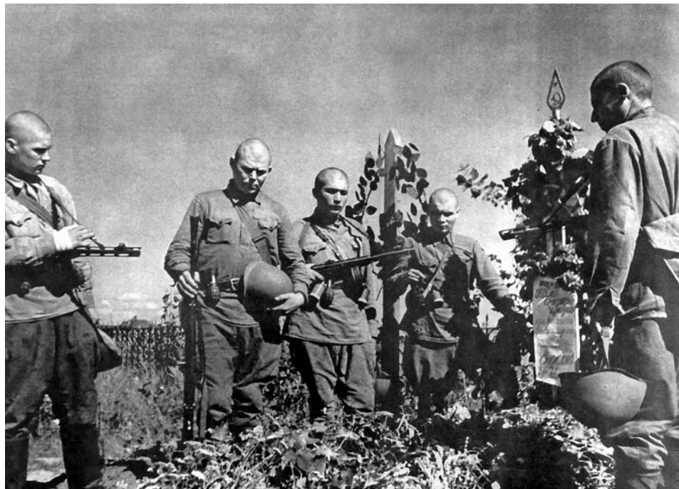
Прощание с боевым товарищем