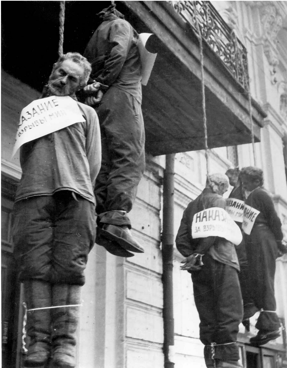
Фашистский террор на Украине