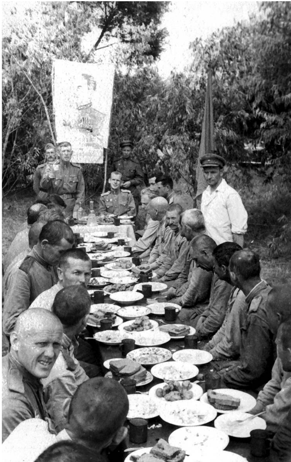
Взвод на отдыхе в тылу