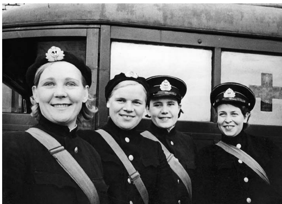
Медсестры Северного флота