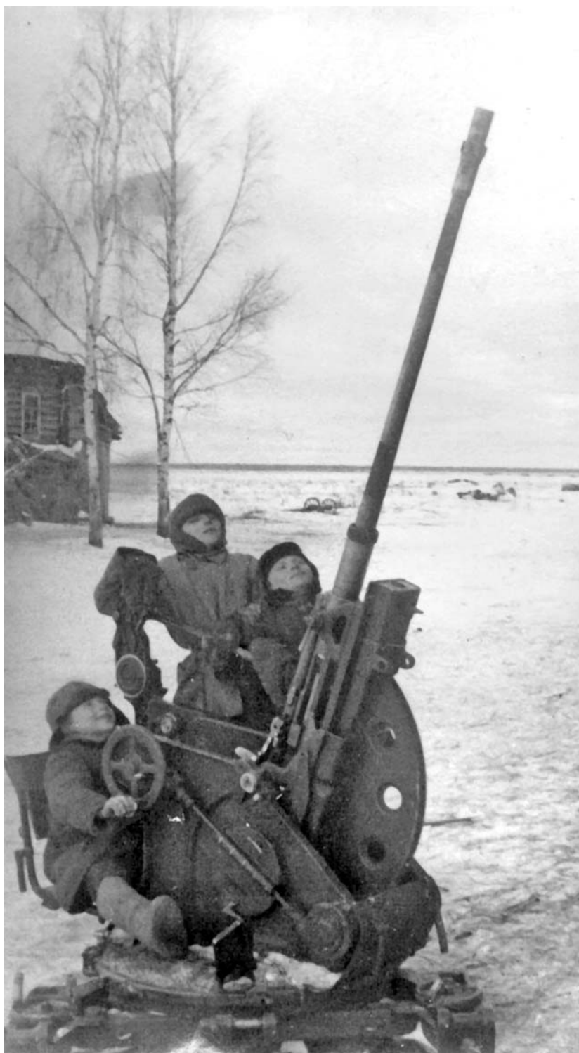
Брошенная немецкая зенитка в качестве игрушки для советских детей