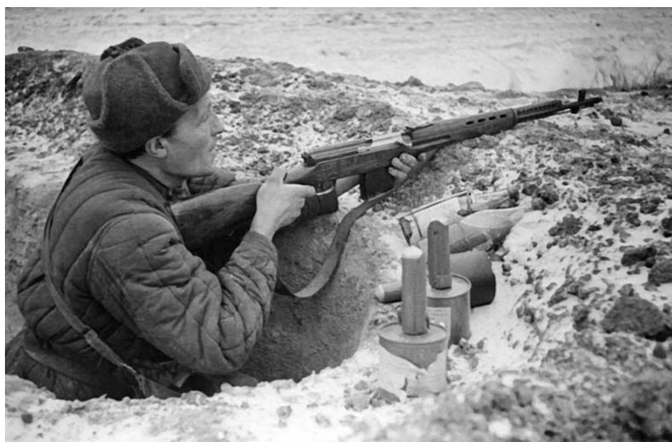
Советский пехотинец на огневой позиции