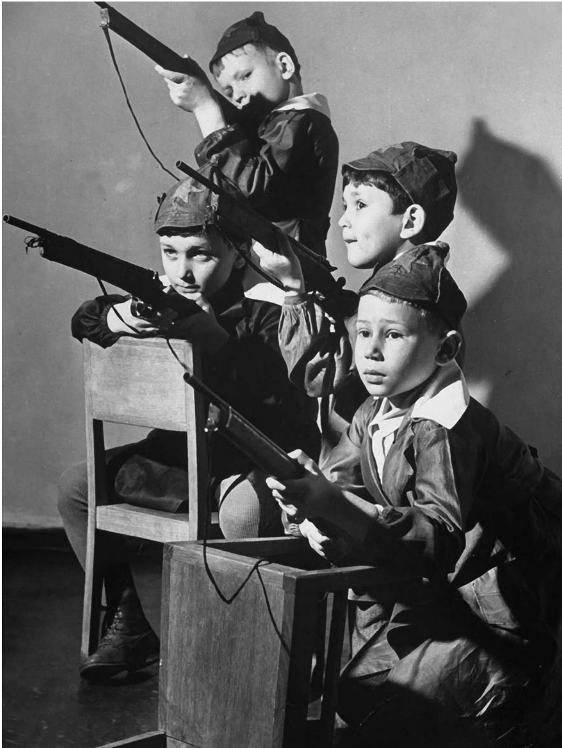
Будущие защитники Родины в одном из детских садов Москвы