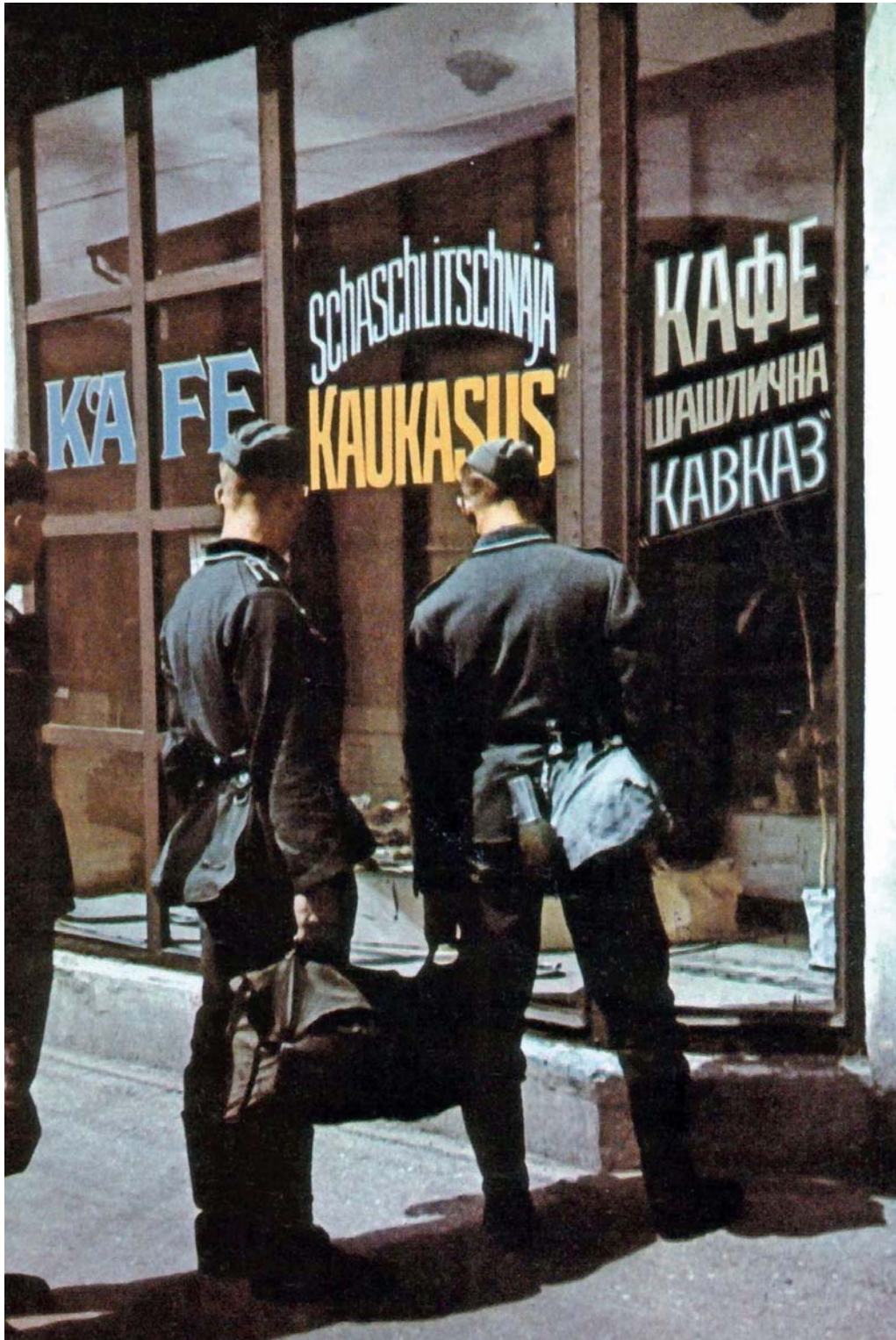
Немецкие солдаты у витрины харьковского кафе