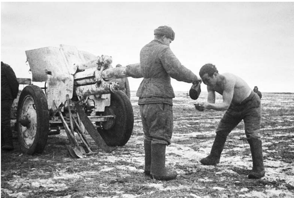
Артиллеристы — народ закаленный!