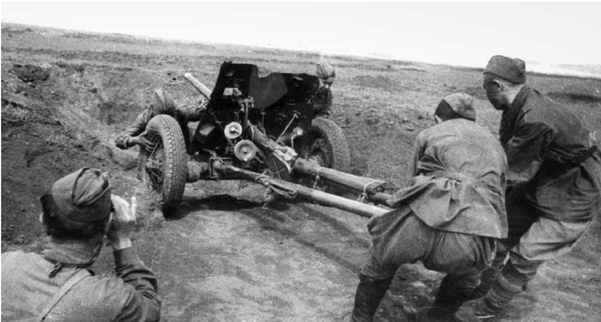
Гвардейский расчет противотанкового орудия готовится к отражению атаки