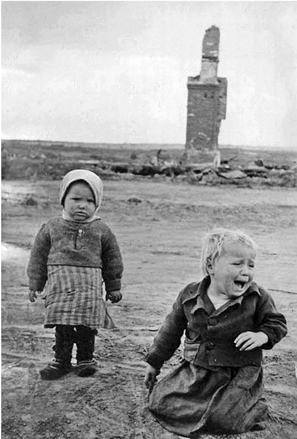
Маленькие дети возле разрушенного дома в Белоруссии