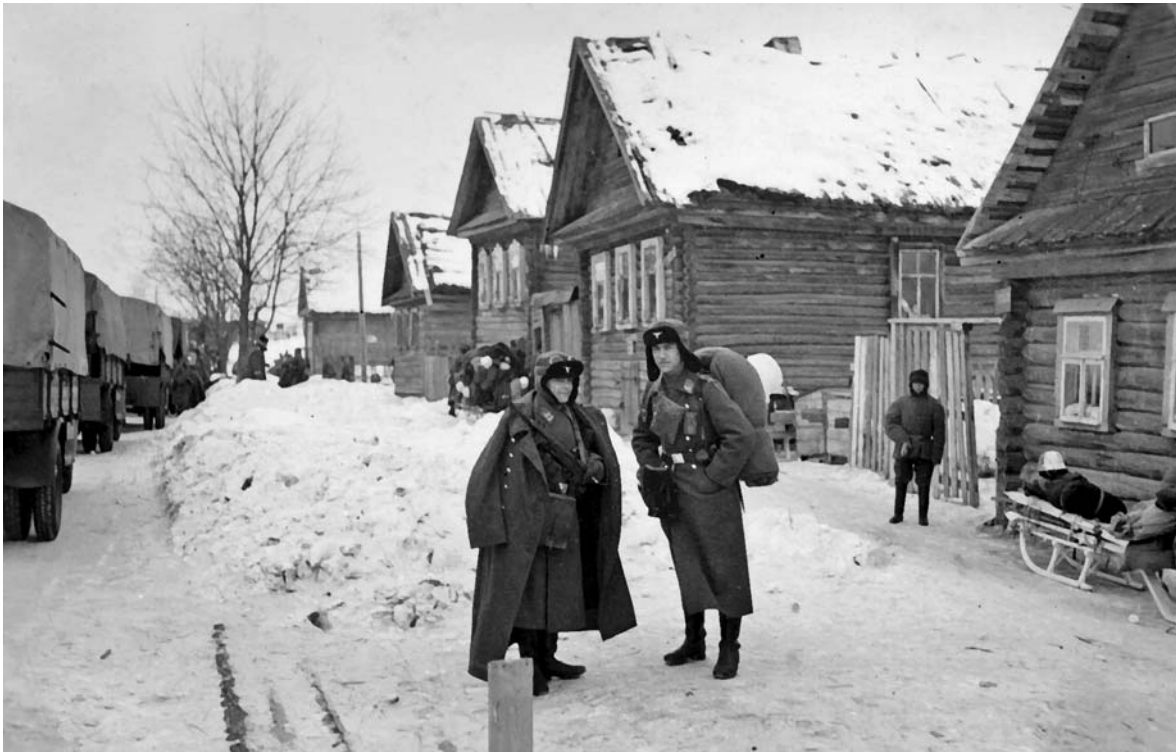
Солдаты полевой дивизии люфтваффе в одной из русских деревень

Для «защиты урожая» на Украине была создана вооруженная охрана, которая имела право с каждым, кто попытается похитить или испортить зерно либо окажет сопротивление при его изъятии, расправляться как с партизаном, то есть убивать на месте. Сельские старосты, волостные старшины и полицейские активно содействовали оккупантам при реквизициях продовольствия и проведении связанных с этим репрессий. Несмотря на террор, крестьяне во многих районах затягивали сдачу продуктов, прятали зерно и картофель, оказывали в ряде случаев активное сопротивление при реквизициях продовольствия.