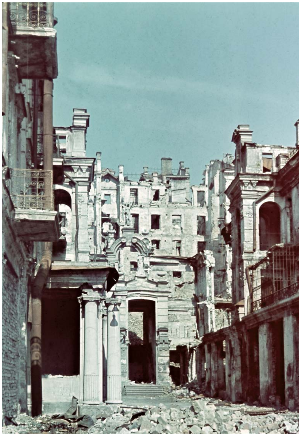
Руины здания «Малого пассажа» на Крещатике в оккупированной столице Украинской ССР