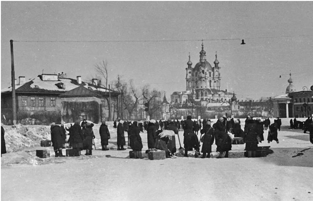
Группа жителей блокадного Ленинграда на Суворовском проспекте перед эвакуацией