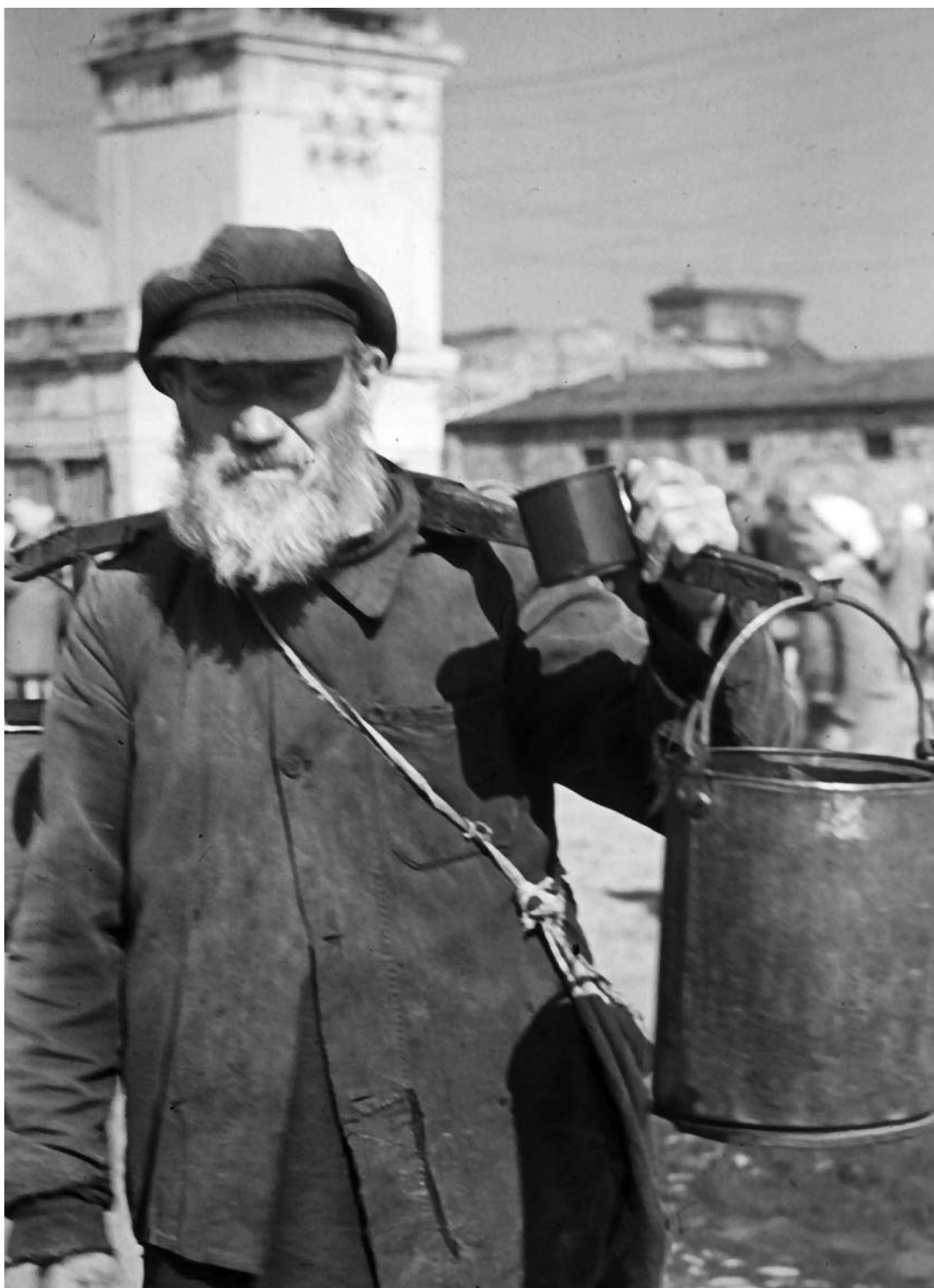
Старик-водонос на Базарной площади оккупированного Смоленска