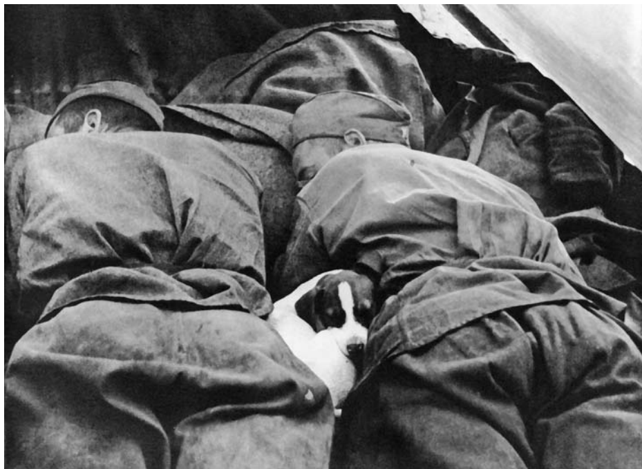
Вместе на отдыхе — вместе в бою!