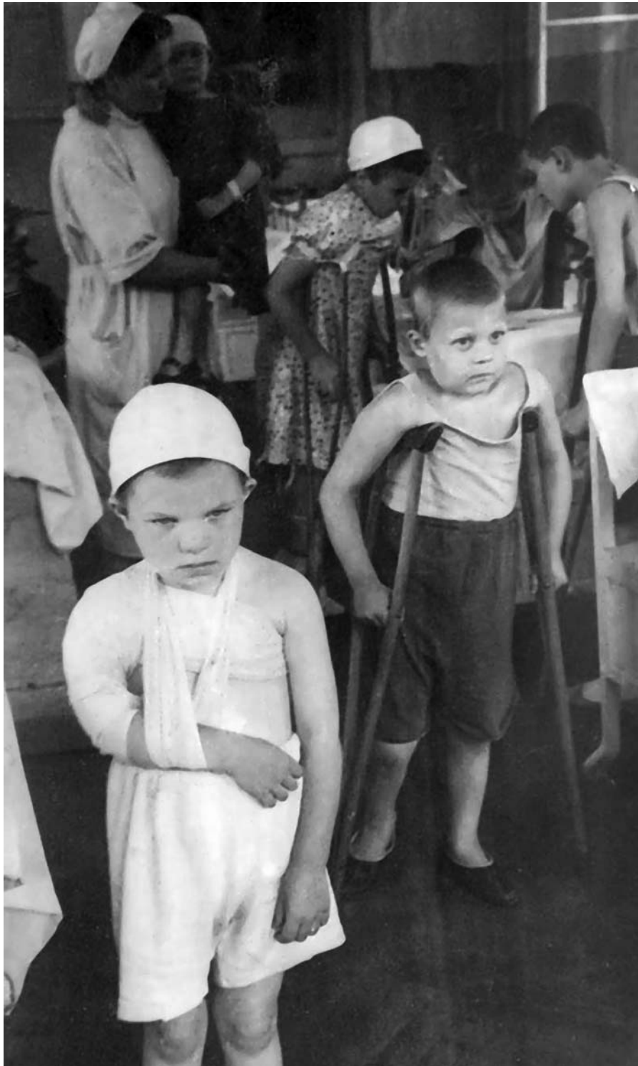
Раненые малыши на лечении в Ленинградском педиатрическом институте