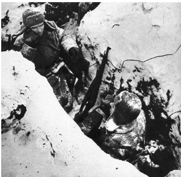
Командир подразделения докладывает обстановку на передовой