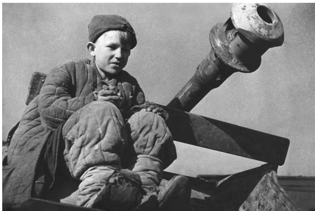
Подросток на брошенном немцами артиллерийском орудии