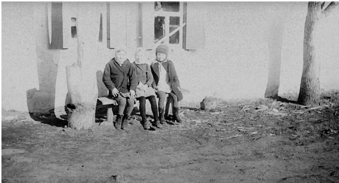
Три подружки под окном