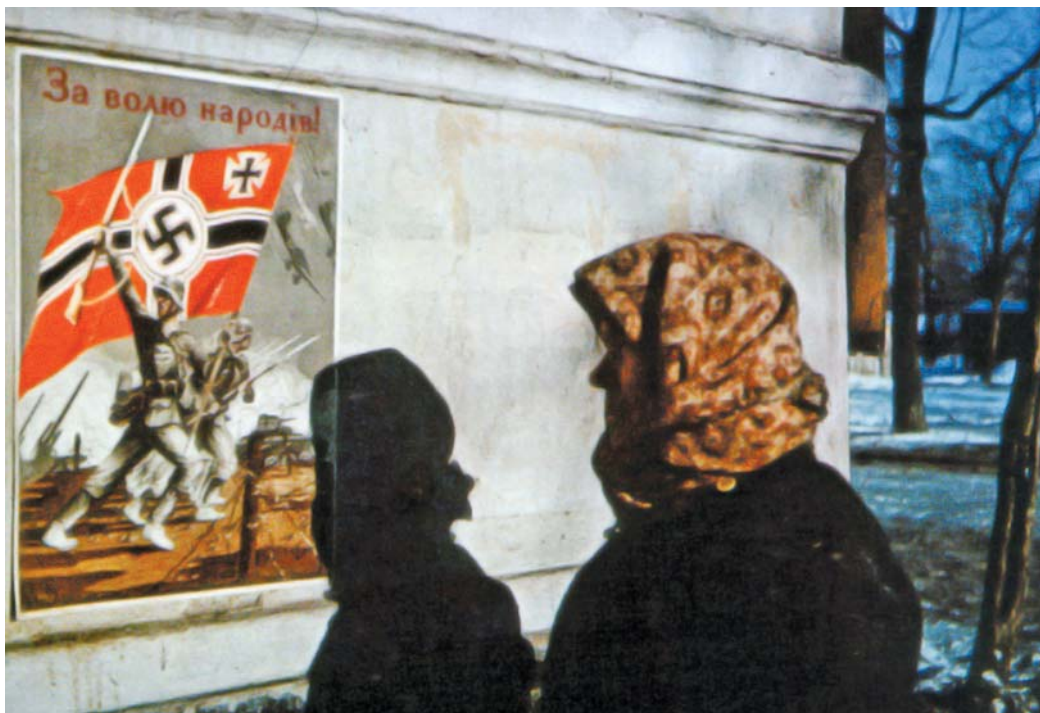
Харьковчанка рассматривает немецкий пропагандистский плакат