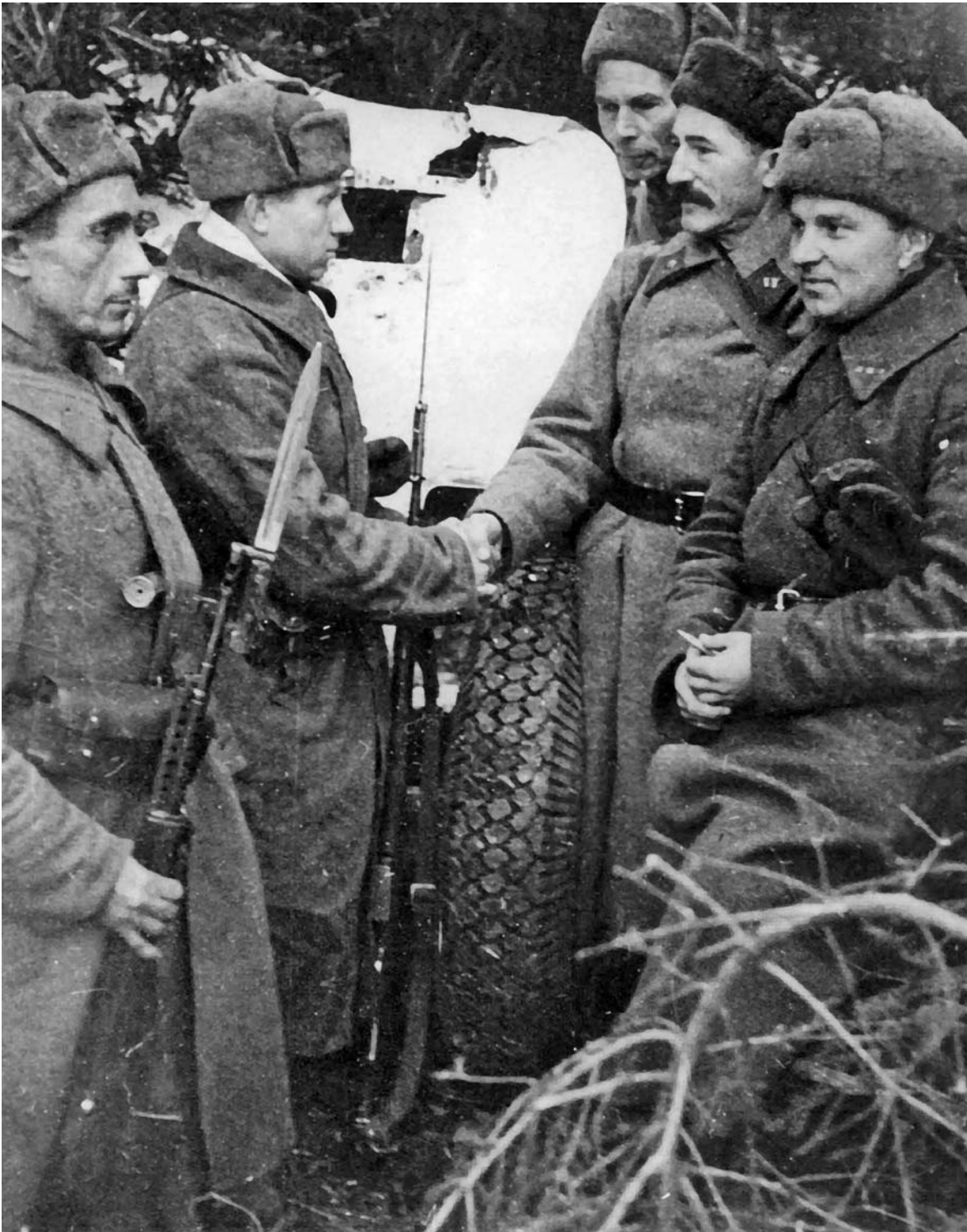
Вручение фронтовикам партбилетов