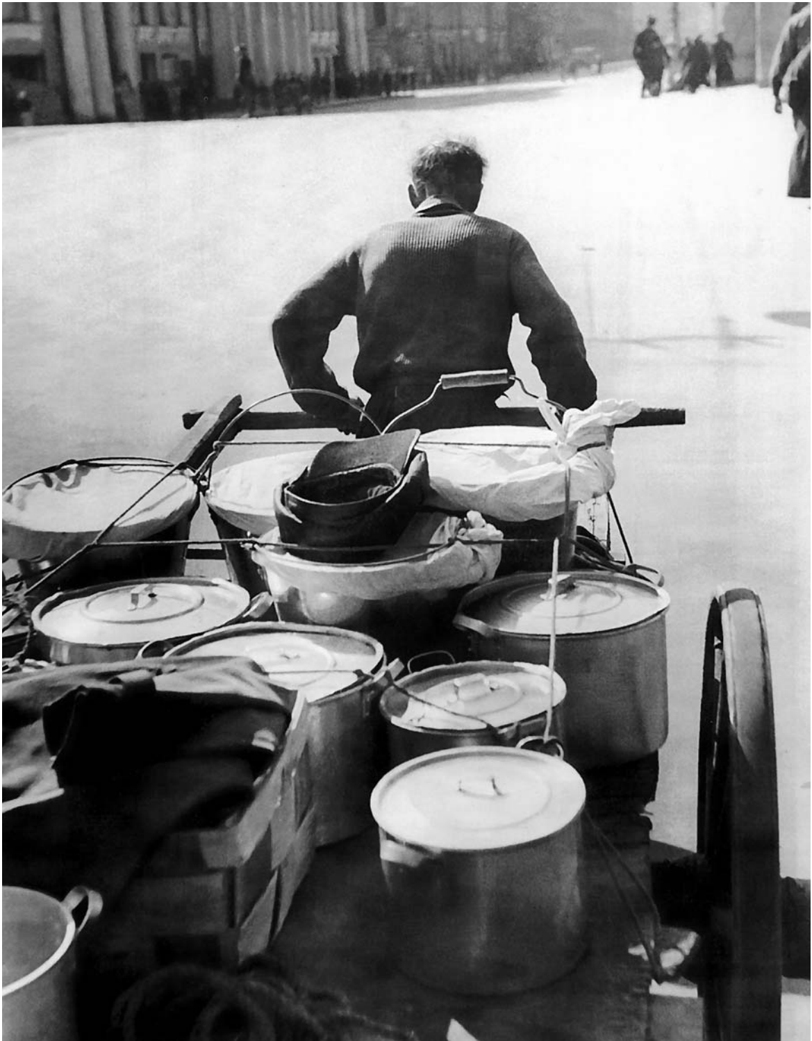
Доставка обеда служащим одного из ленинградских предприятий