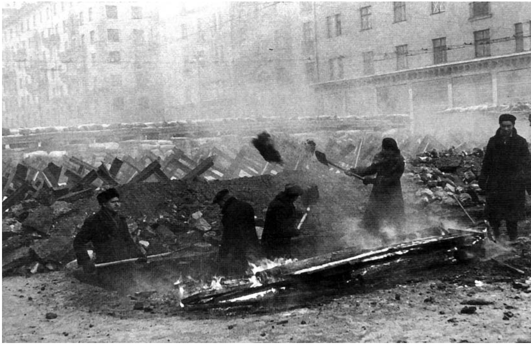
Жители столицы строят на улицах баррикады