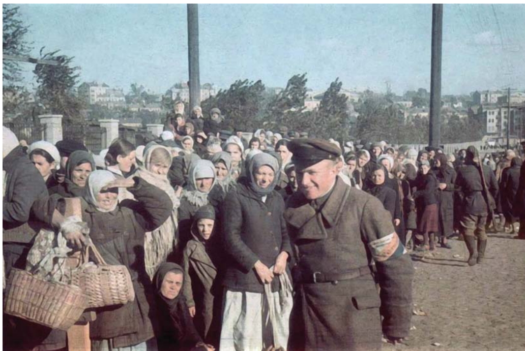
Украинский полицай позирует немецкому фотографу на фоне женщин, пришедших узнать у оккупационных властей о судьбе арестованных близких