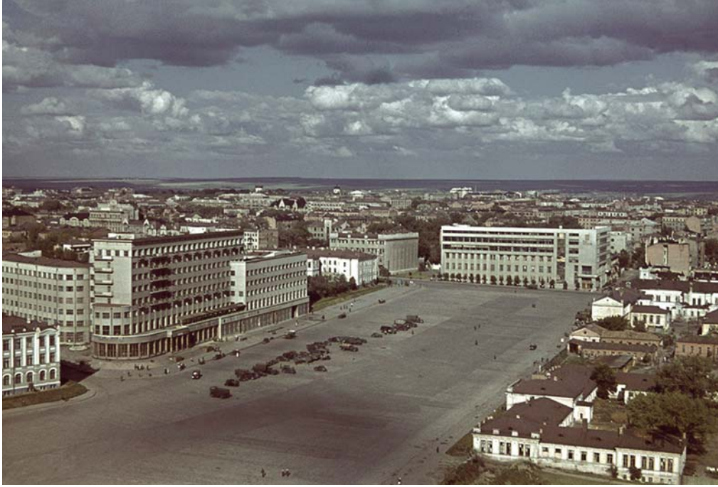
Немецкие автомобили на харьковской площади Свободы