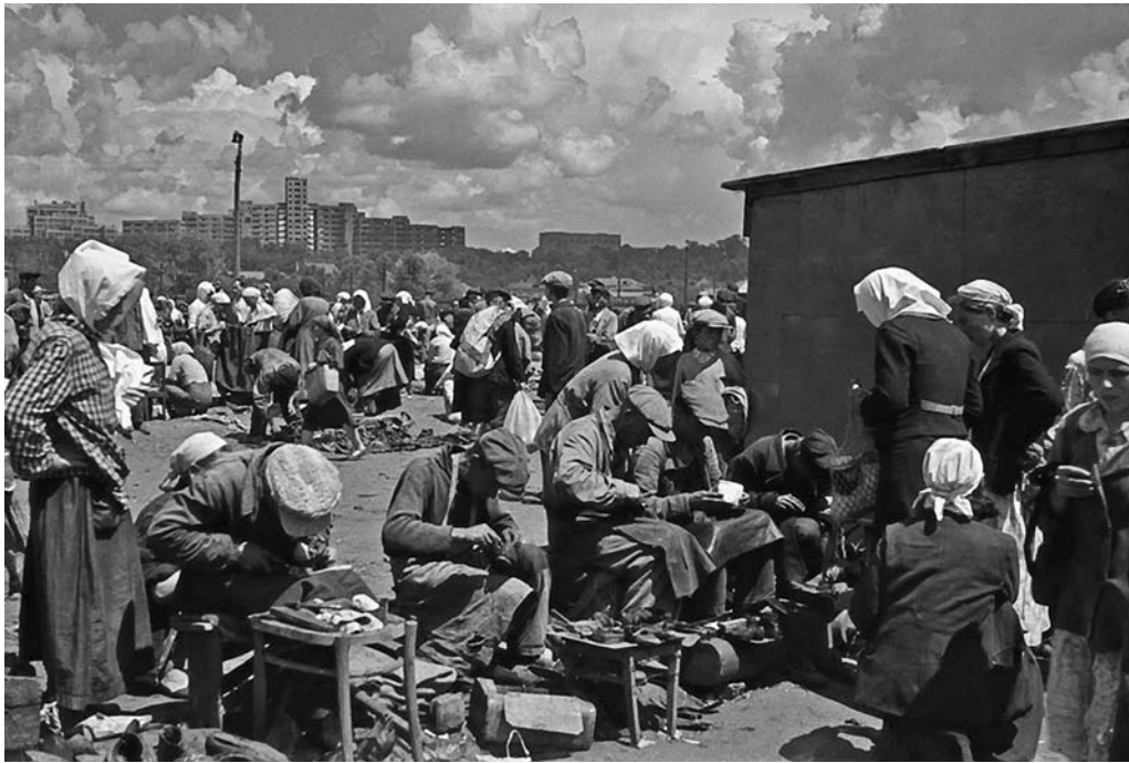
Благовещенский рынок в занятом фашистами Харькове