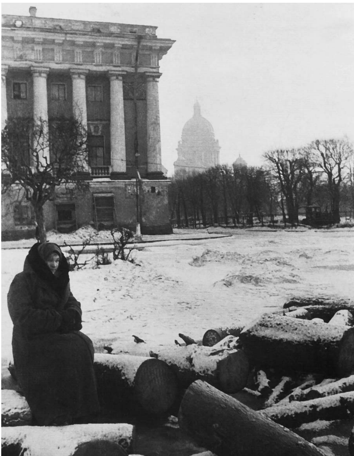
Блокадница на набережной Рошалья у штабеля дров