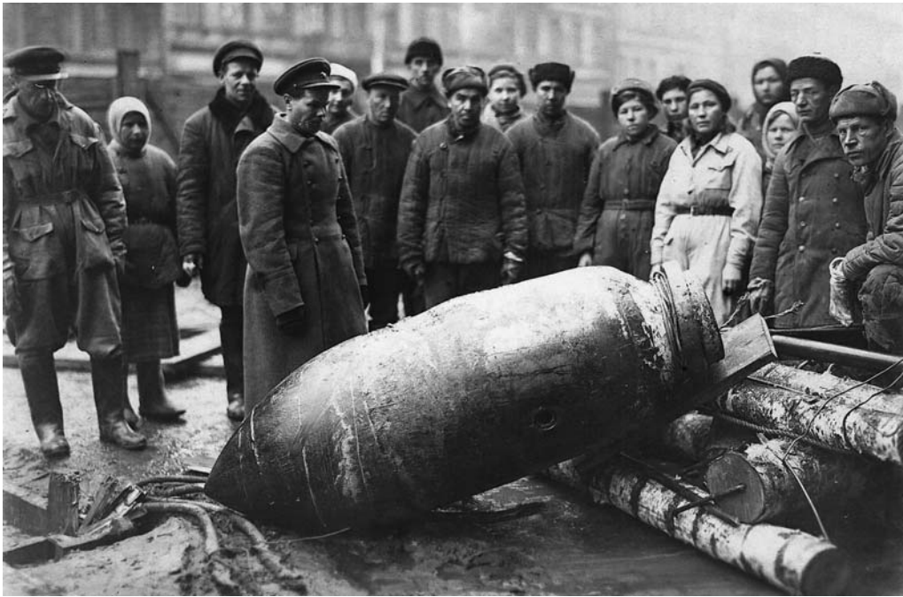
К счастью, эта бомба не взорвалась...