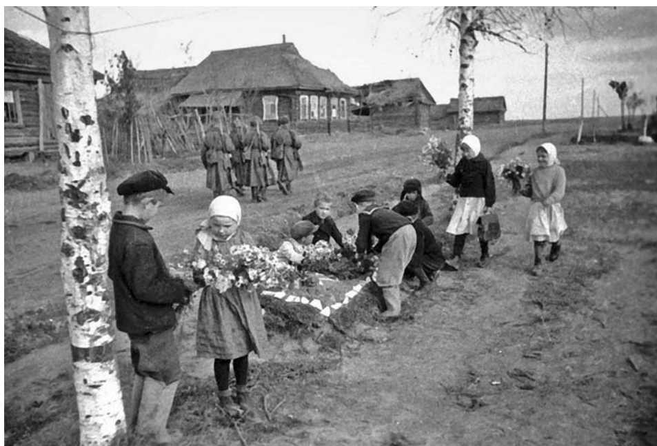
Дети у могил советских бойцов, павших в боях за освобождение Ржева