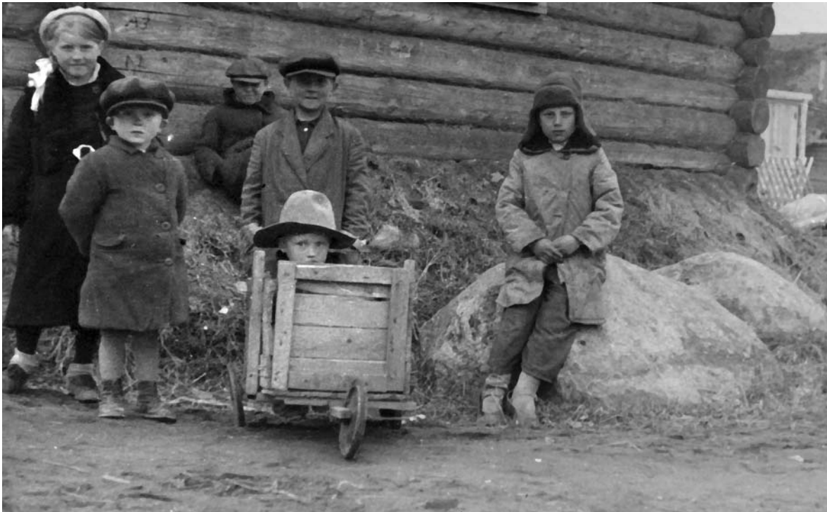
Дети в оккупированном селе Псковской области