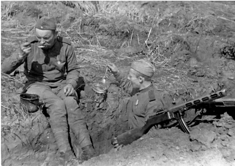
Нехитрая солдатская еда