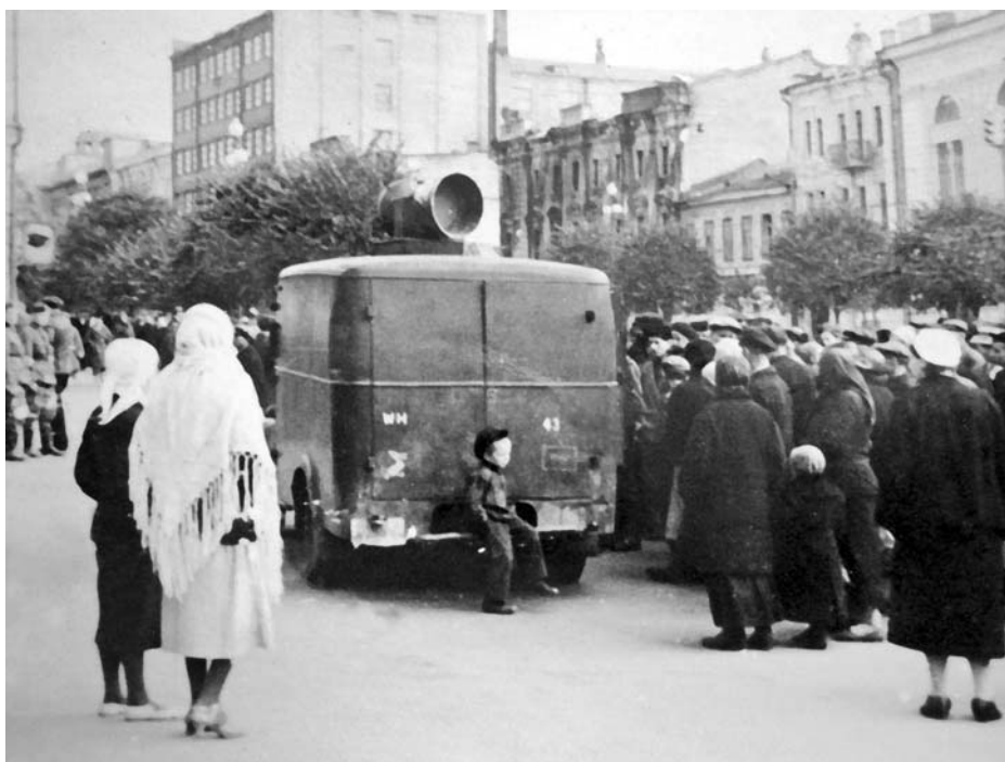
Немецкие оккупационные власти Киева объявляют об эвакуации населения