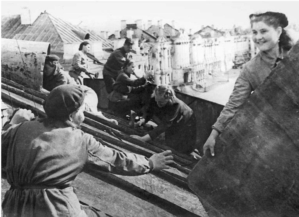
Ленинградская молодежь — бойцы МПВО за ремонт крыши здания