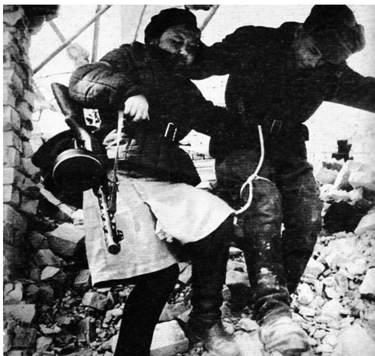
Девушка-санинструктор сопровождает раненого солдата