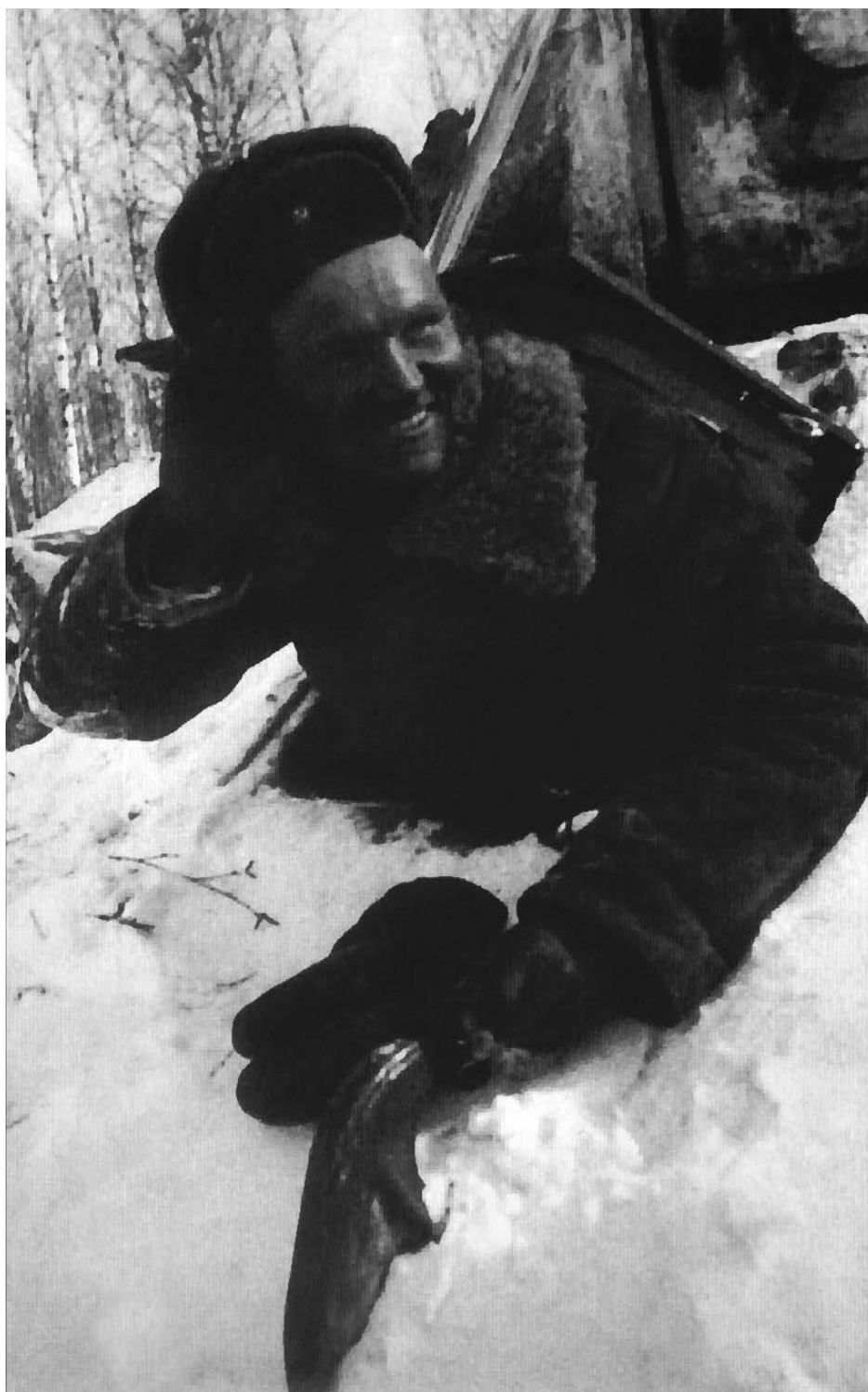
Механик-водитель танка Т-34