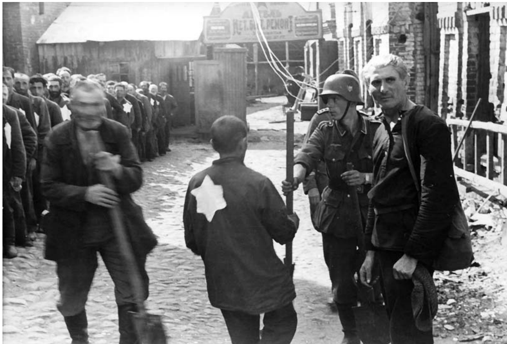
Отправка могилевских евреев на принудительные работы