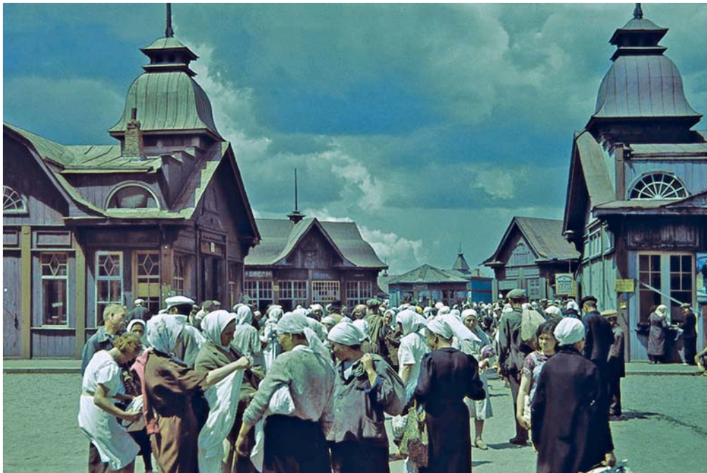
Городской рынок во время оккупации