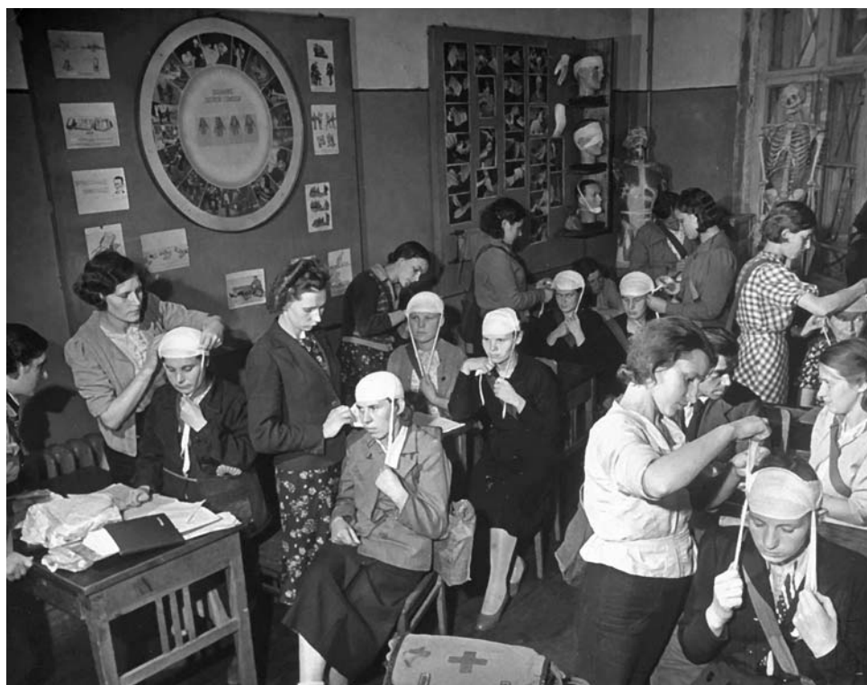
Москвички на курсах по оказанию первой помощи раненым