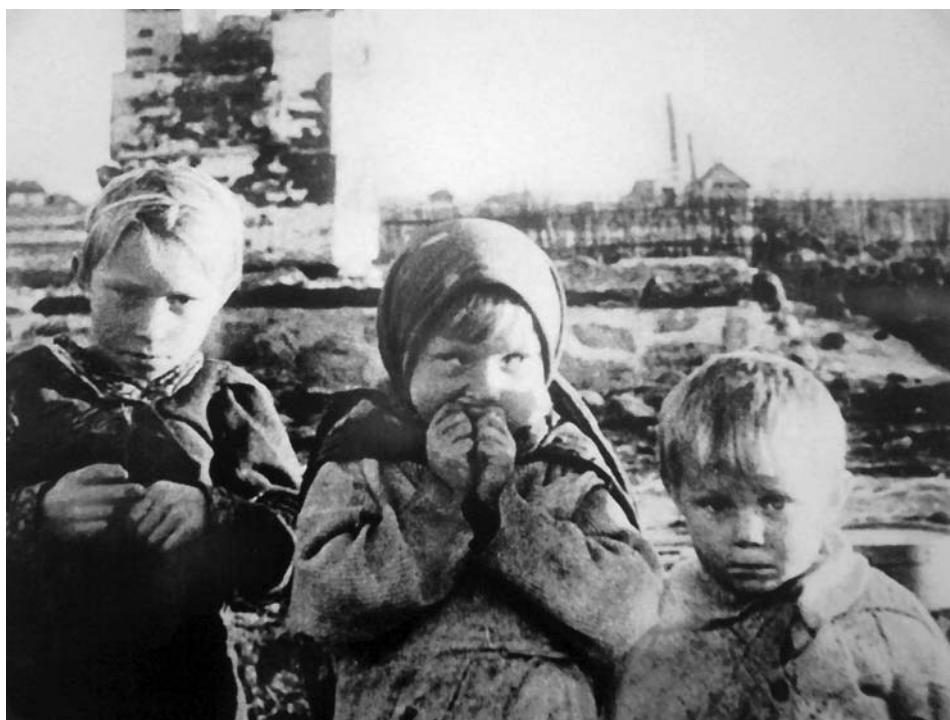
В руинах белорусской деревни Лозоватка