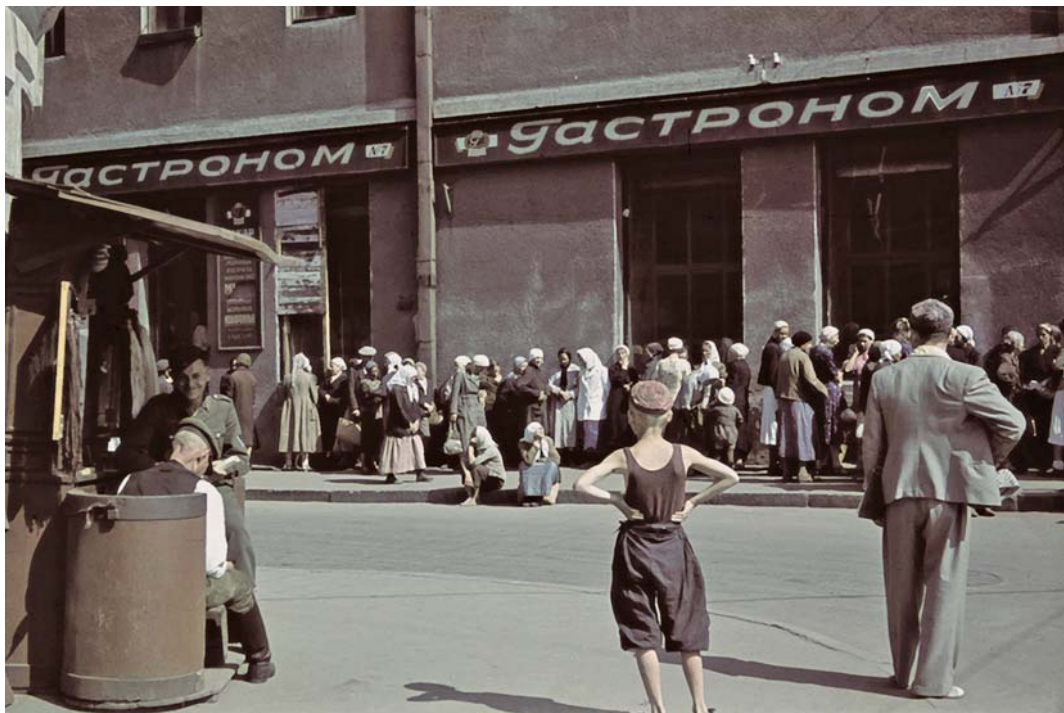
Харьковчане в очереди за продуктами