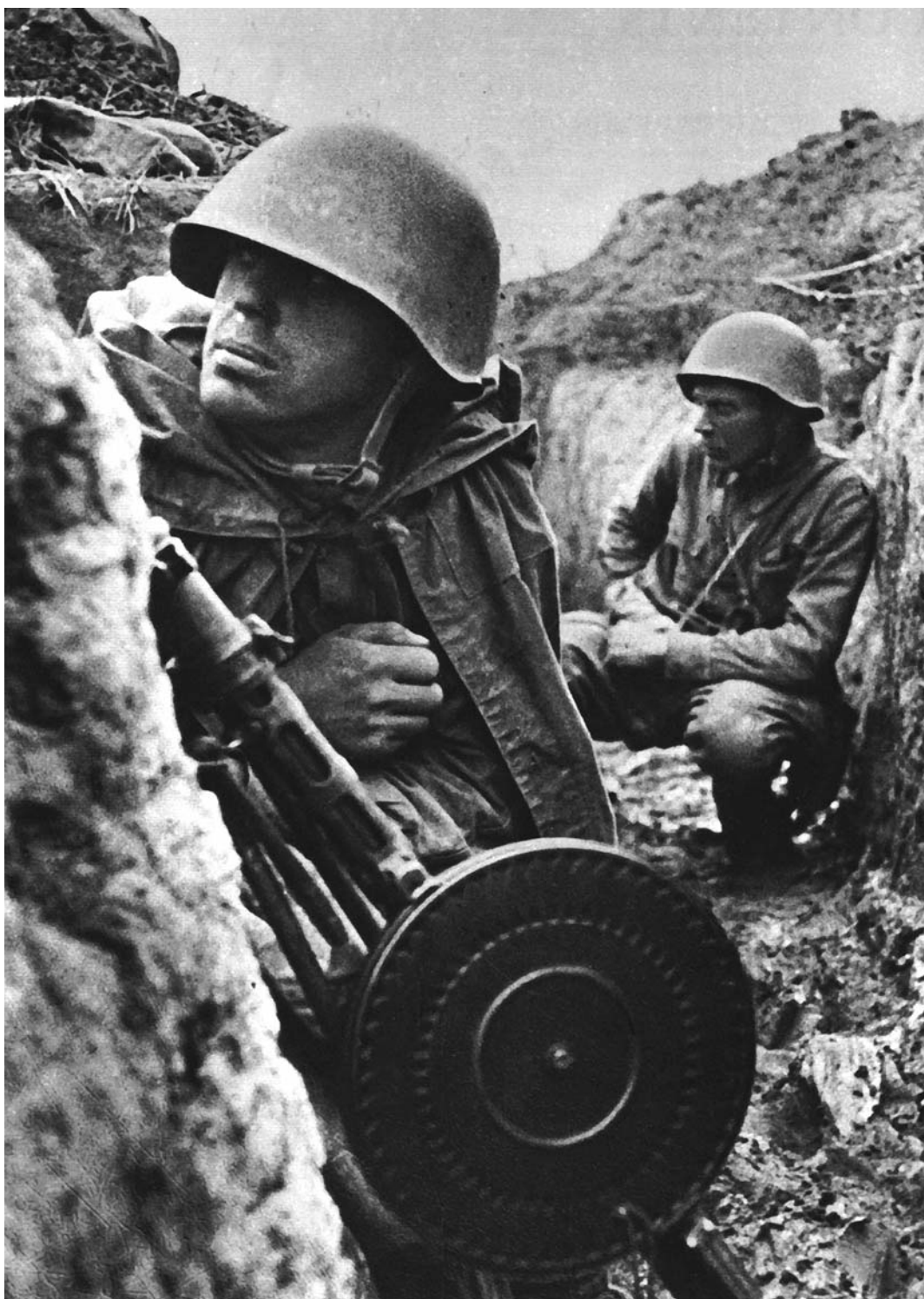
Бойцы 115-й стрелковой дивизии в окопе на Невской Дубровке