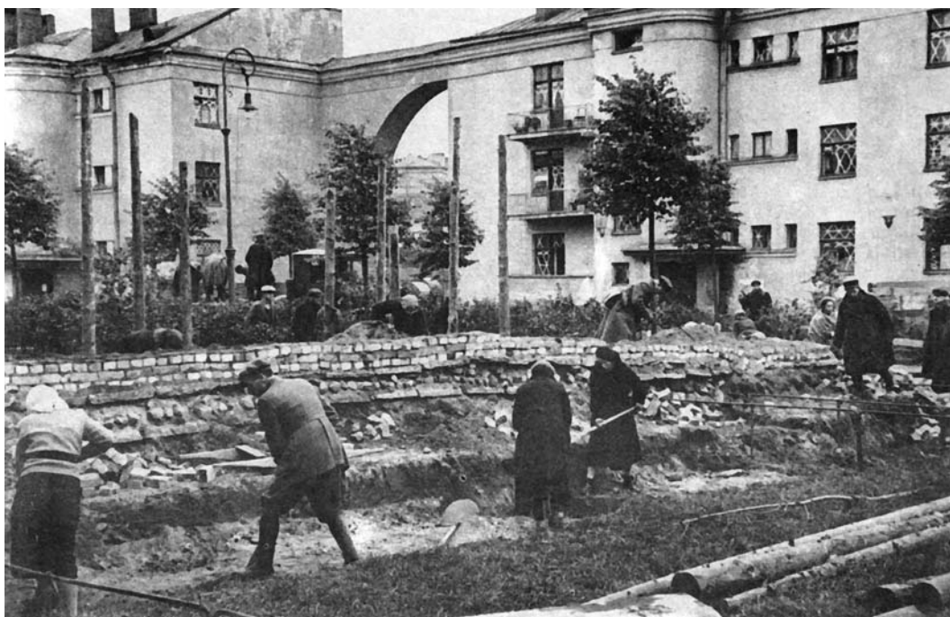
Ленинградцы строят баррикады на Тракторной улице