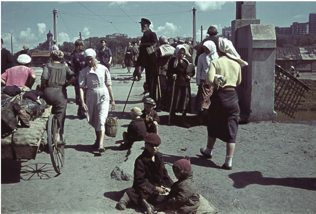
У моста в оккупированном Харькове