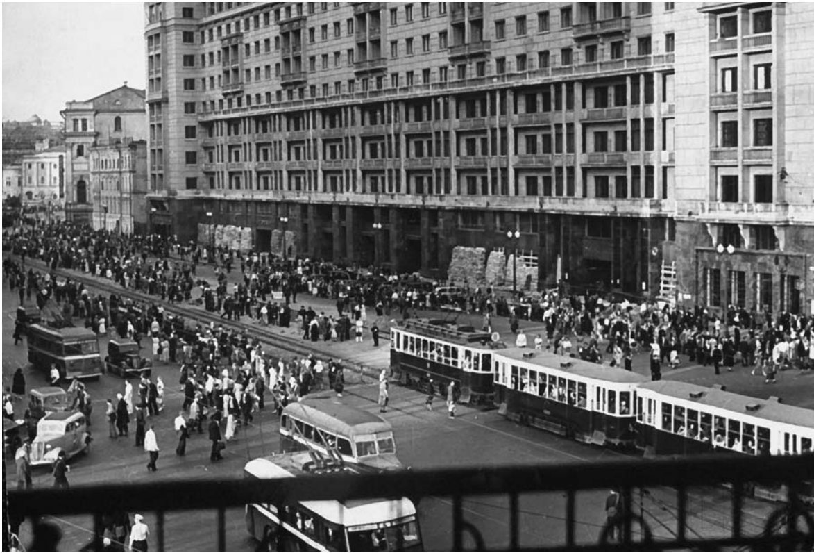
Горожане выходят из укрытий в Москве после отбоя воздушной тревоги