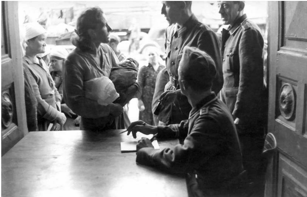
Регистрация местных жителей в оккупированном Могилёве